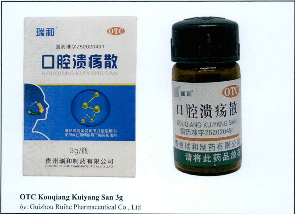
OTC Kouqiang Kuiyang San 3g by: Guizhou Ruihe Pharmaceutical Co., Ltd