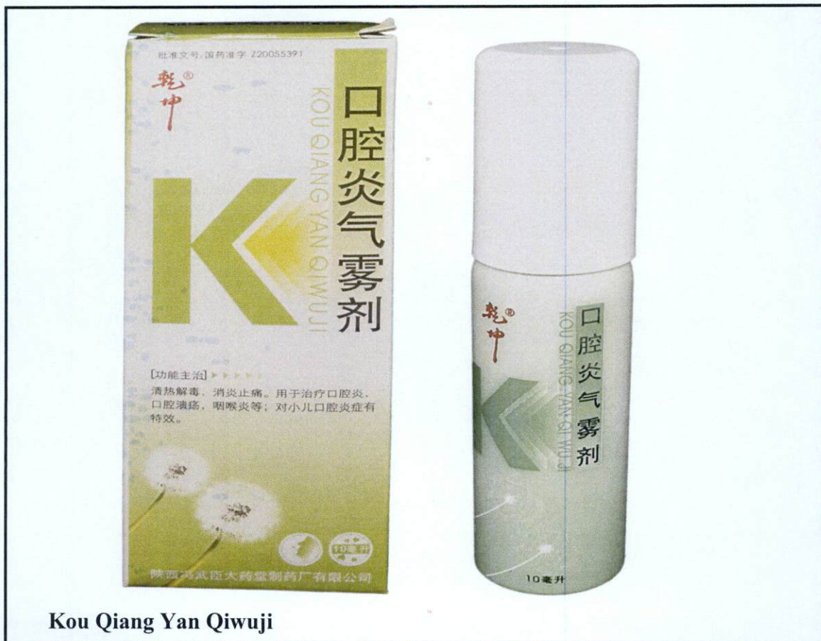
Kou Qiang Yan Qiwuji

Pinapayuhan ng Food and Drug Administration (FDA) ang publiko laban sa pagbili at paggamit ng mga sumusunod na hindi rehistradong gamot: