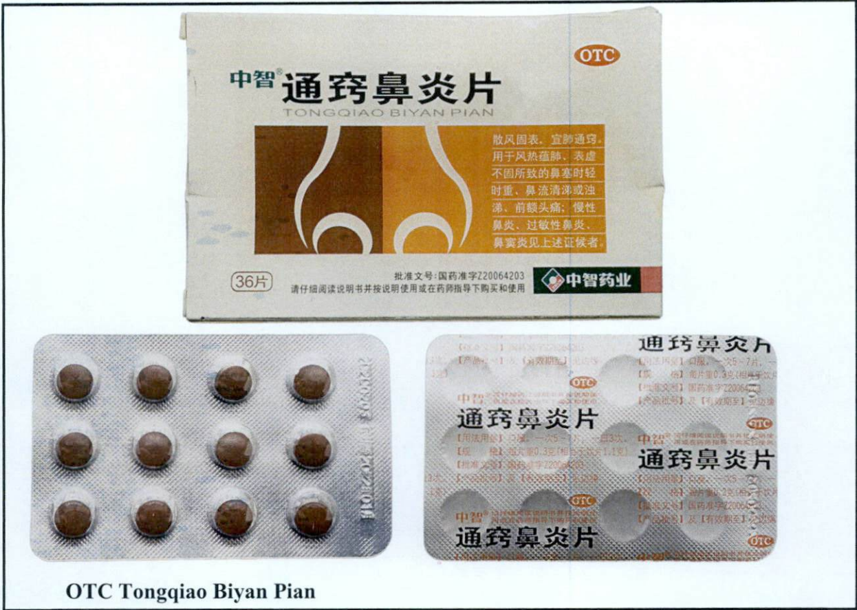
OTC Tongqiao Biyan Pian