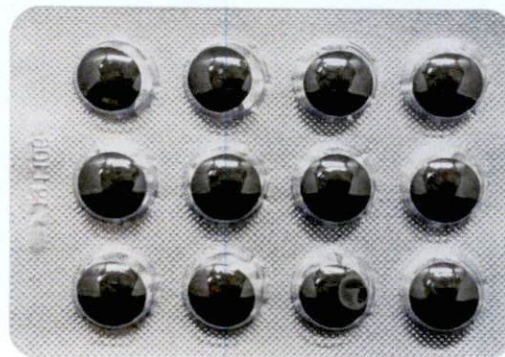
OTC Tian Ma Tou Tong Pian