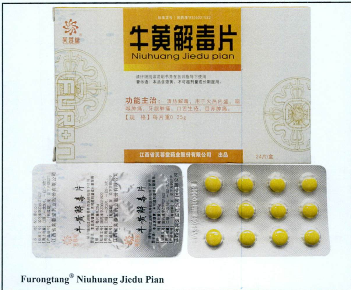
Furongtang® Niuhuang Jiedu Pian

Pinapayuhan ng Food and Drug Administration (FDA) ang publiko laban sa pagbili at paggamit ng mga sumusunod na hindi rehistradong gamot: