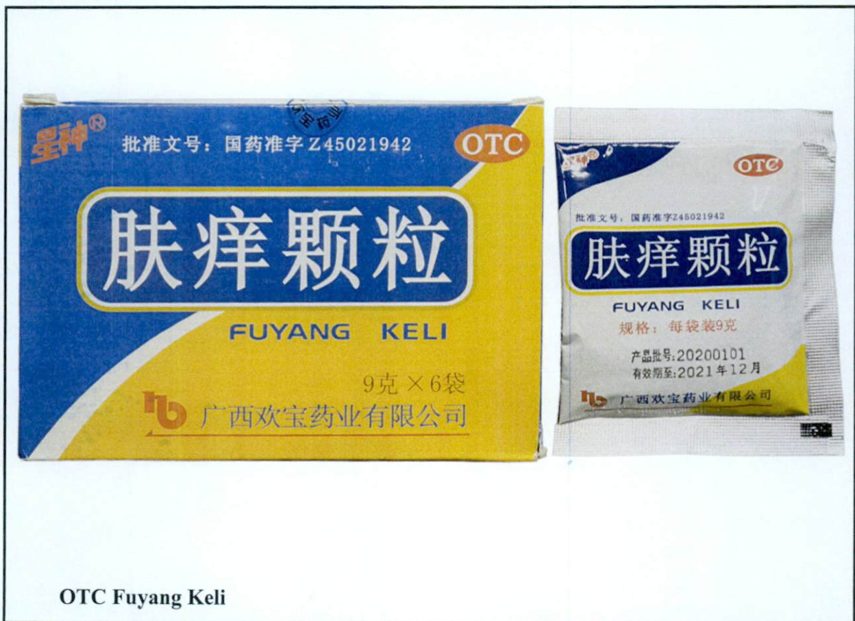
Larawan 5. Hindi rehistradong gamot