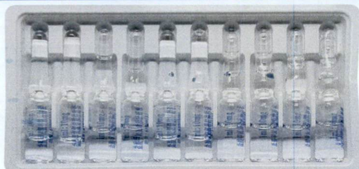
Yansuan Jiayang Lupu'an Zhusheye 1ml:10mg