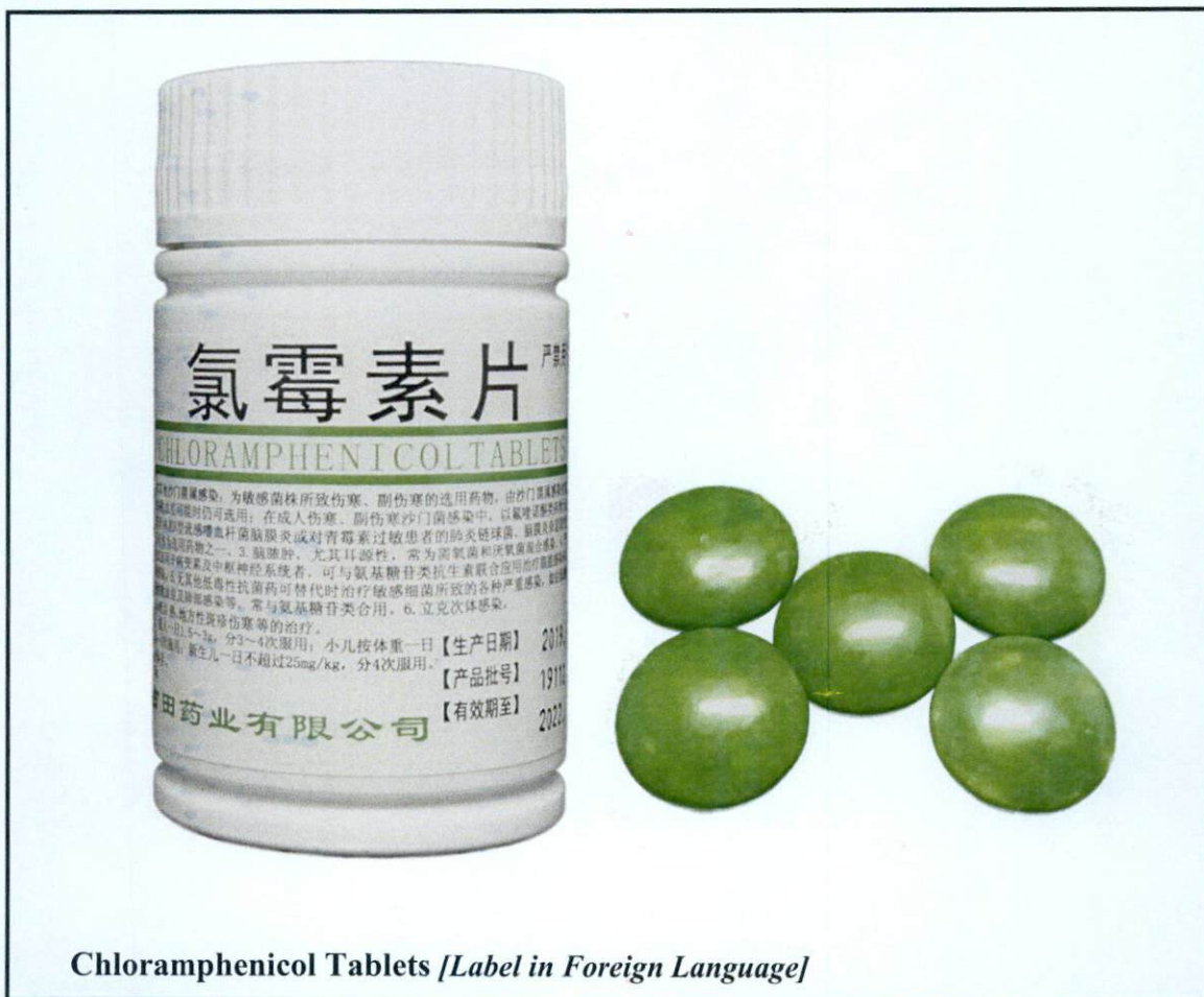
Chloramphenicol Tablets [Label in Foreign Language]

Pinapayuhan ng Food and Drug Administration (FDA) ang publiko laban sa pagbili at paggamit ng mga sumusunod na hindi rehistradong gamot: