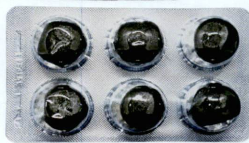
OTC 111 Miaoji Wan [as reflected in the package insert] by: Shaanxi Lijun Modern Tcm Co., Ltd