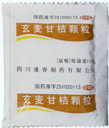
OTC Xuanmai Ganjie Keli by: Sichuan Fengchun Pharmaceutical Co., Ltd.