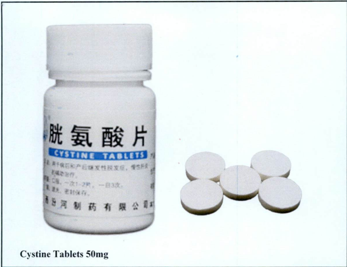
Cystine Tablets 50mg