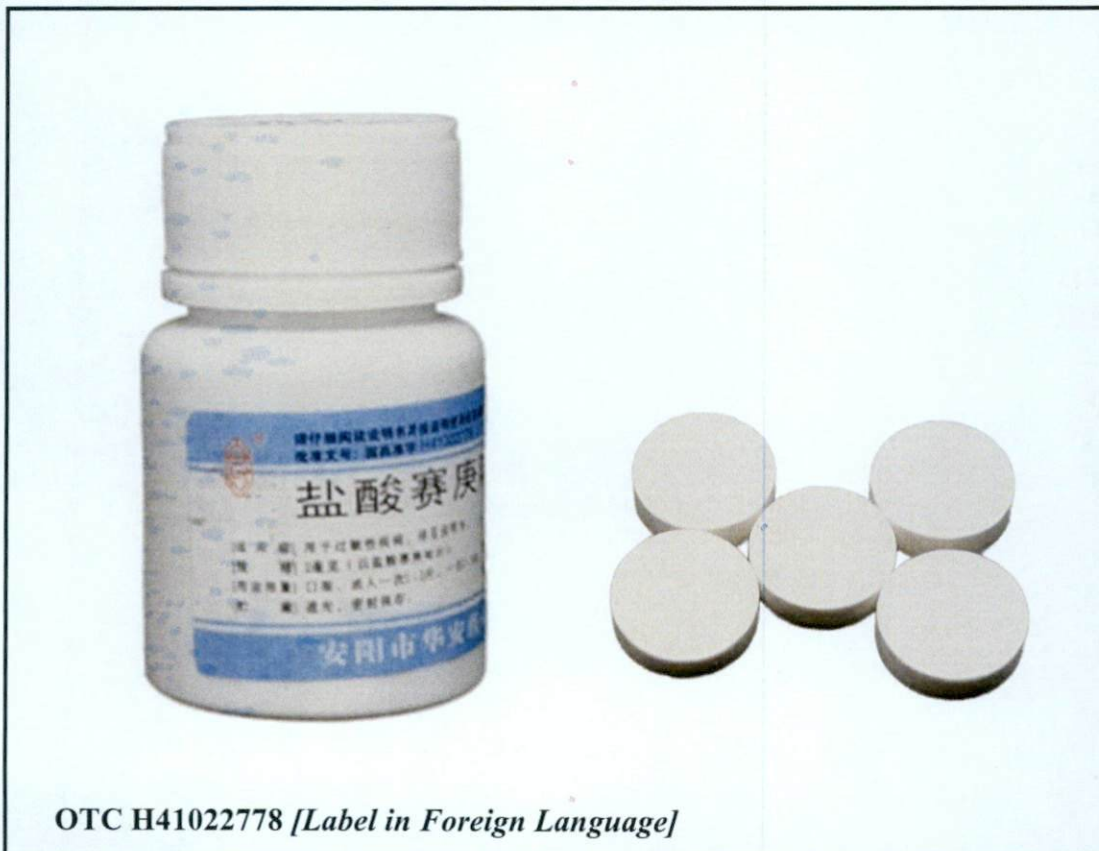
OTC H41022778 [Label in Foreign Language]

Pinapayuhan ng Food and Drug Administration (FDA) ang publiko laban sa pagbili at paggamit ng mga sumusunod na hindi rehistradong gamot: