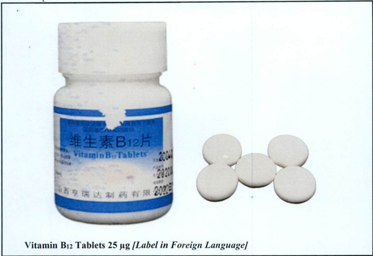
Vitamin B 12 Tablets 25 µg [Label in Foreign Language]