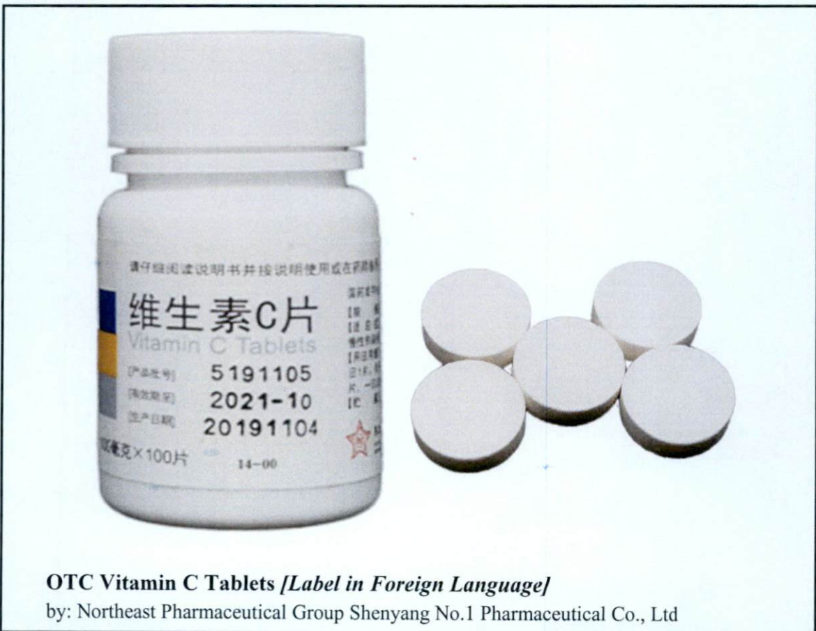
OTC Vitamin C Tablets [Label in Foreign Language]

by: Northeast Pharmaceutical Group Shenyang No.1 Pharmaceutical Co., Ltd