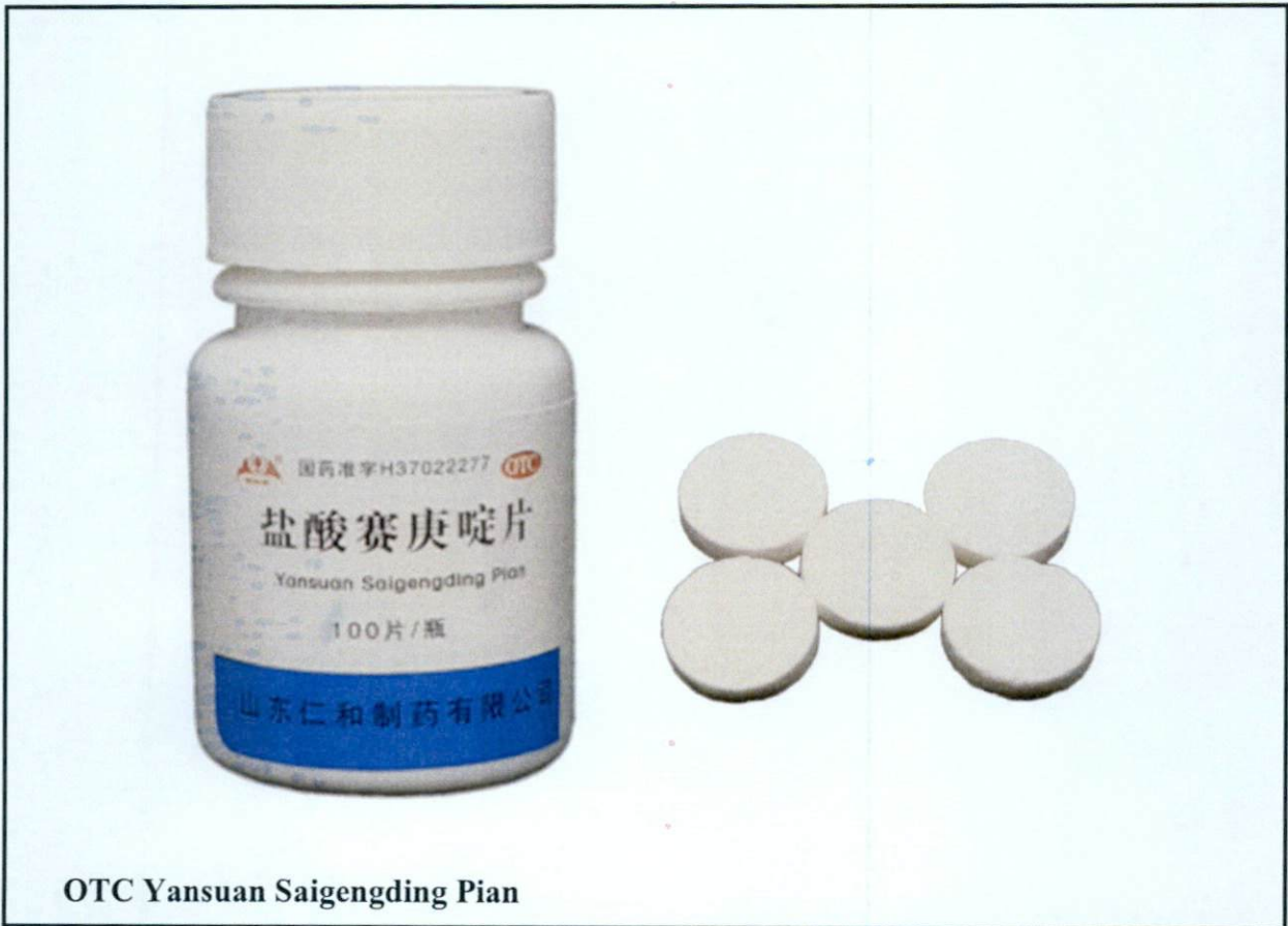
OTC Yansuan Saigengding Pian