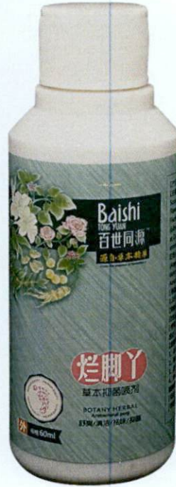
Baishi Tong Yuan 60mL