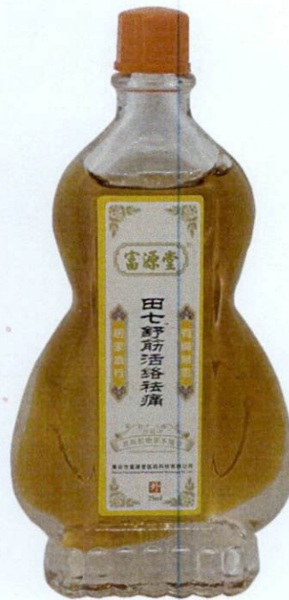
Extraction Herbaceous Essense 25mL by: Gao'an Fuyuantang Pharmaceutical Technology Co., Ltd.