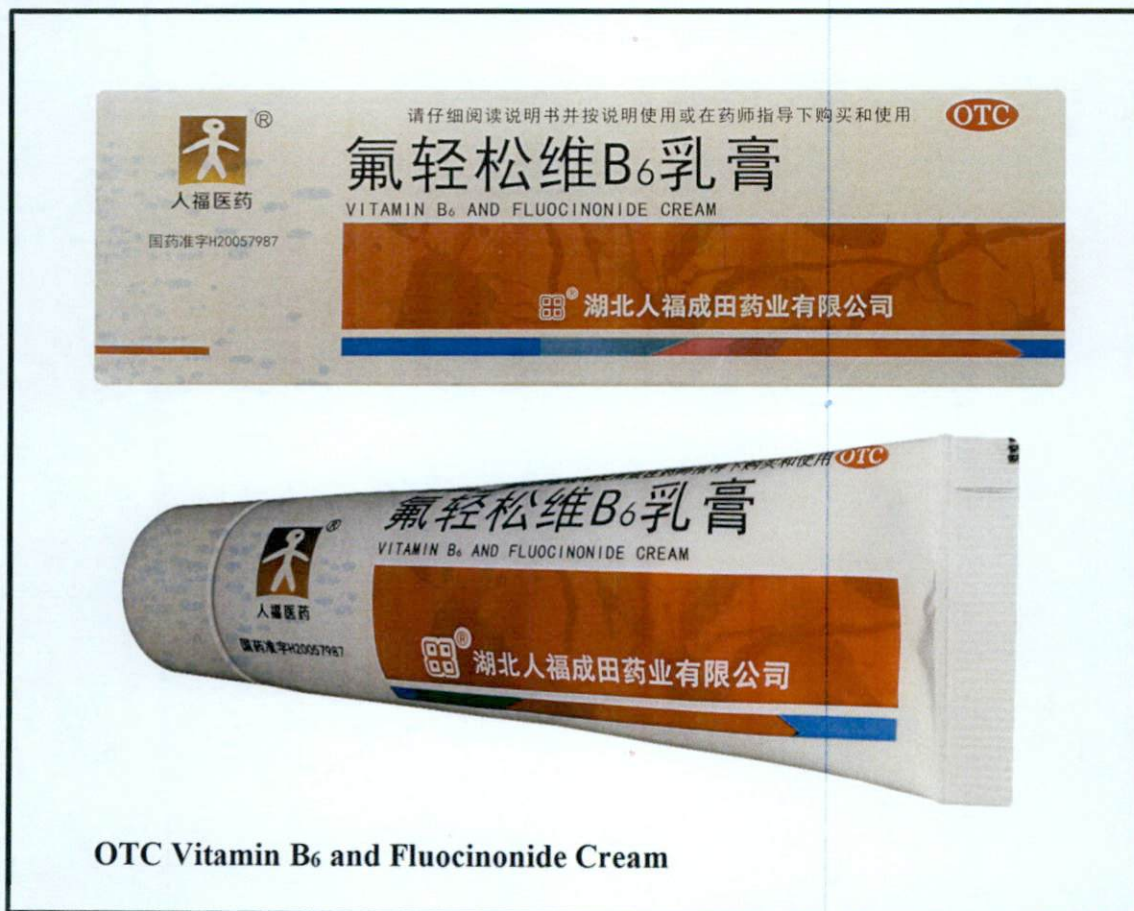
OTC Vitamin B 6 and Fluocinonide Cream

Pinapayuhan ng Food and Drug Administration (FDA) ang publiko laban sa pagbili at paggamit ng mga sumusunod na hindi rehistradong gamot: