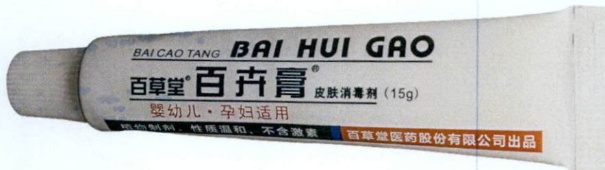
Bct Bai Cao Tang Bai Hui Gao 15g