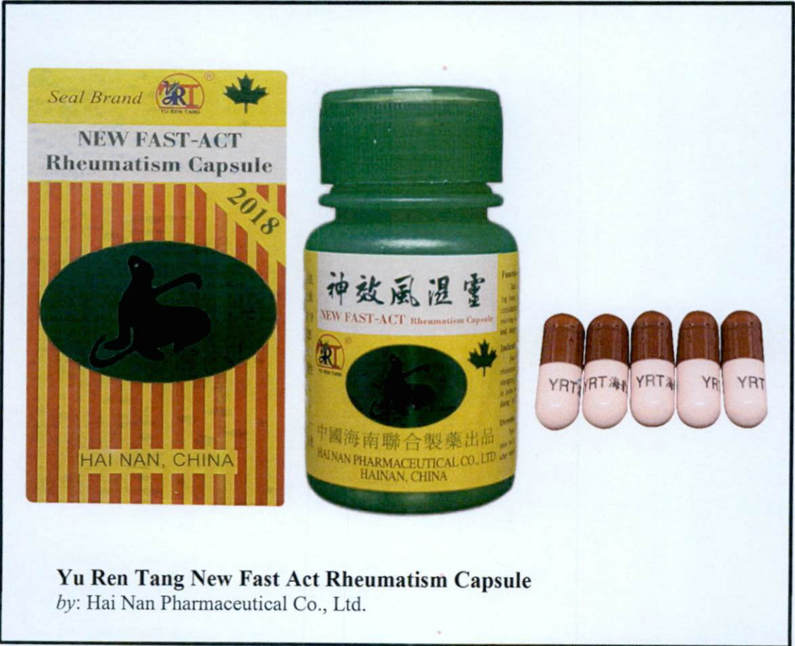
Yu Ren Tang New Fast Act Rheumatism Capsule by: Hai Nan Pharmaceutical Co., Ltd.