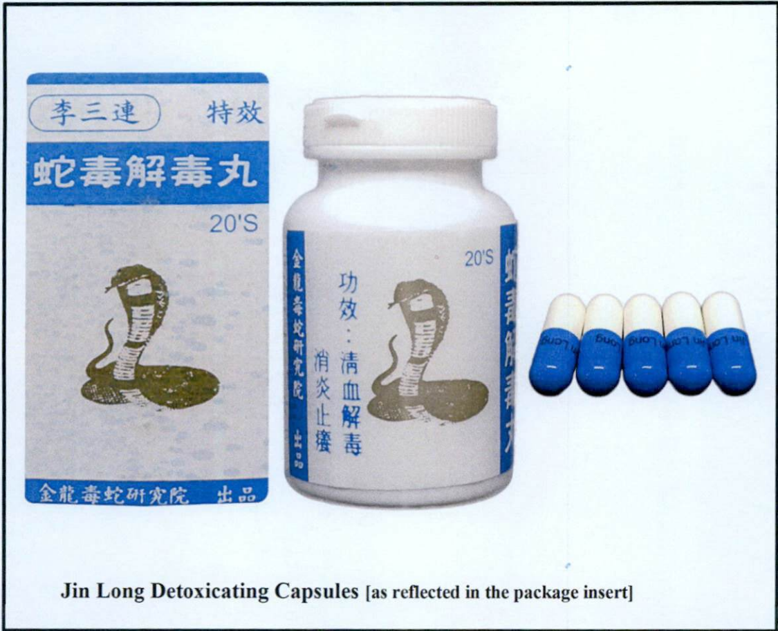
Jin Long Detoxicating Capsules [as reflected in the package insert]