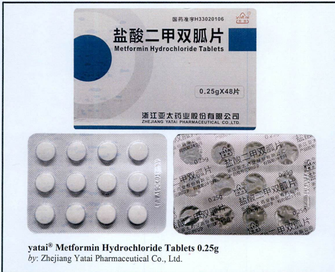
yatai® Metformin Hydrochloride Tablets 0.25g by: Zhejiang Yatai Pharmaceutical Co., Ltd.

Pinapayuhan ng Food and Drug Administration (FDA) ang publiko laban sa pagbili at paggamit ng mga sumusunod na hindi rehistradong gamot: