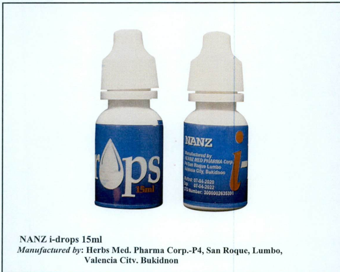
NANZ i-drops 15ml Manufactured by: Herbs Med. Pharma Corp.-P4, San Roque, Lumbo, Valencia Citv. Bukidnon

Pinapayuhan ng Food and Drug Administration (FDA) ang publiko laban sa pagbili at paggamit ng hindi rehistradong gamot na: