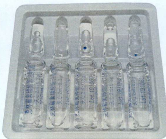
Clindamycin Phosphate Injection 2ml:0.3g