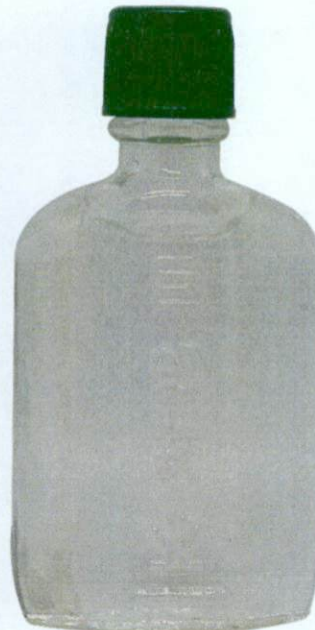
OTC HUA SHAN® Baihua You 5mL by: Guangzhou Juhong Pharmaceutical Co., Ltd. - No. 9 Lianglong Road, huashan Town, Huadu District, Guangzhou