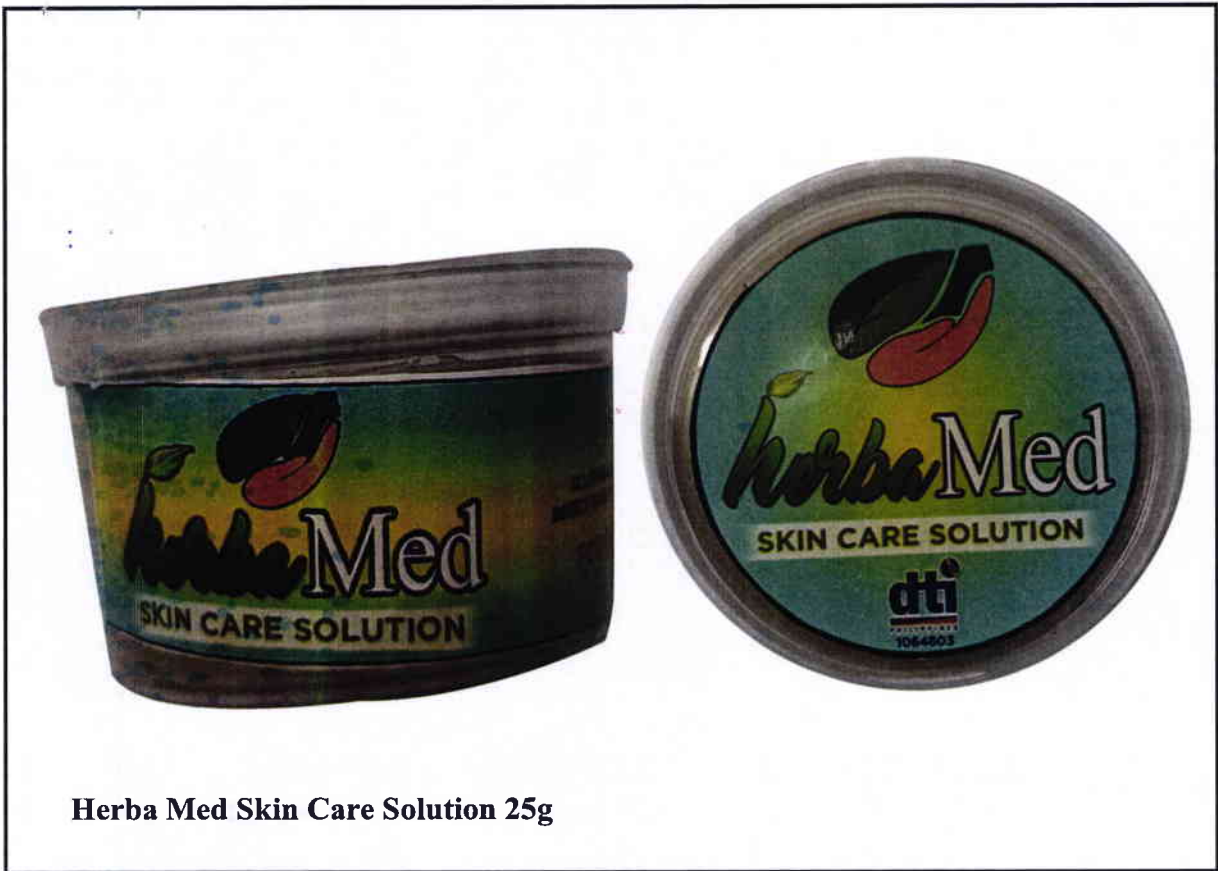
Herba Med Skin Care Solution 25g