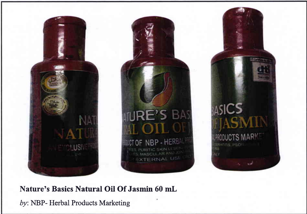
Nature's Basics Natural Oil Of Jasmin 60 mL