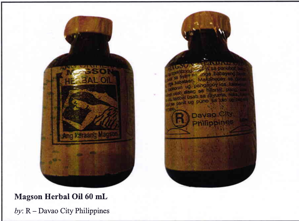
Larawan 4. Hindi rehistradong gamot

Napatunayan sa pamamagitan ng isinagawang Post-Marketing Surveillance (PMS) ng FDA na ang mga nasabing gamot ay hindi dumaaan sa proseso ng rehistrasyon ng Ahensya at hindi nabigyan ng kaukulang awtorisasyon tulad ng Certificate of Product Registration (CPR). Dahil dito, hindi masisiguro ng Ahensya ang kalidad, kaligtasan at bisa nito. Samakatuwid, ang paggamit ng nasabing mga iligal na produkto ay maaaring magdulot ng panganib sa kalusugan.