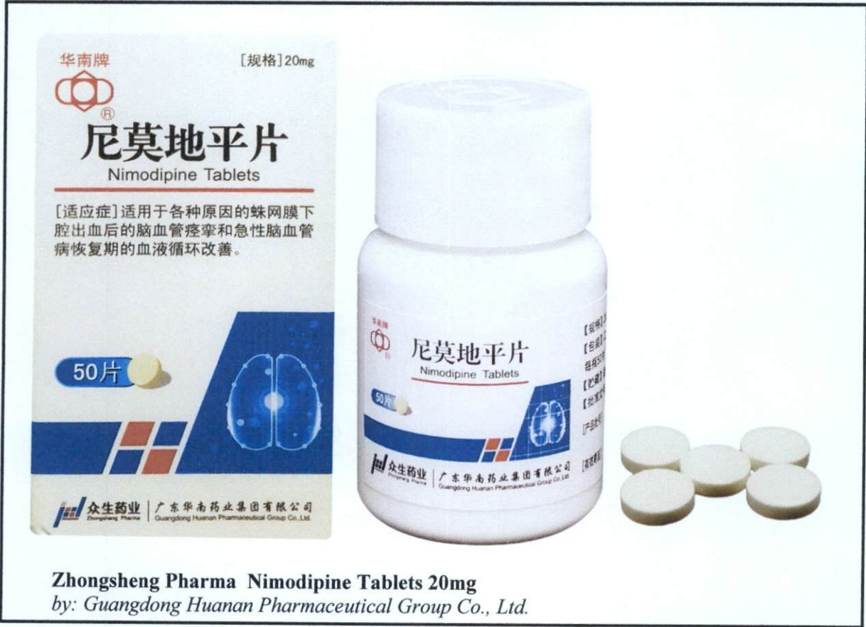
Zhongsheng Pharma Nimodipine Tablets 20mg by: Guangdong Huanan Pharmaceutical Group Co., Ltd.