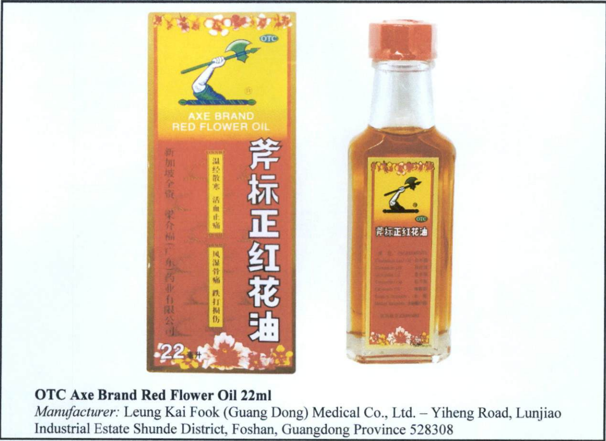
OTC Axe Brand Red Flower Oil 22ml Manufacturer: Leung Kai Fook (Guang Dong) Medical Co., Ltd. – Yiheng Road, Lunjiao Industrial Estate Shunde District, Foshan, Guangdong Province 528308