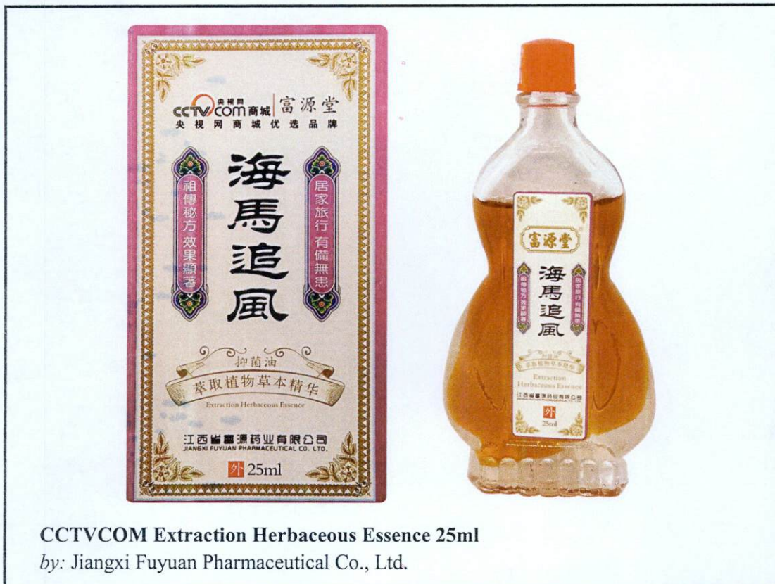
CCTVCOM Extraction Herbaceous Essence 25ml by: Jiangxi Fuyuan Pharmaceutical Co., Ltd.

Pinapayuhan ng Food and Drug Administration (FDA) ang publiko laban sa pagbili at paggamit ng mga sumusunod na hindi rehistradong gamot: