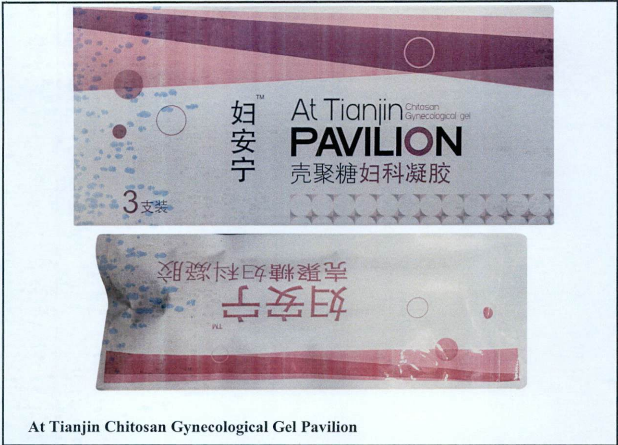
At Tianjin Chitosan Gynecological Gel Pavilion