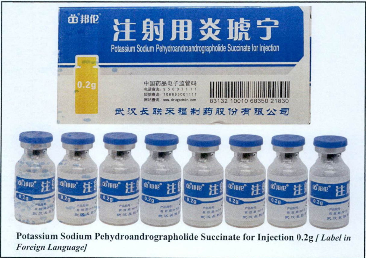
Potassium Sodium Pehydroandrographolide Succinate for Injection 0.2g [Label in Foreign Language]