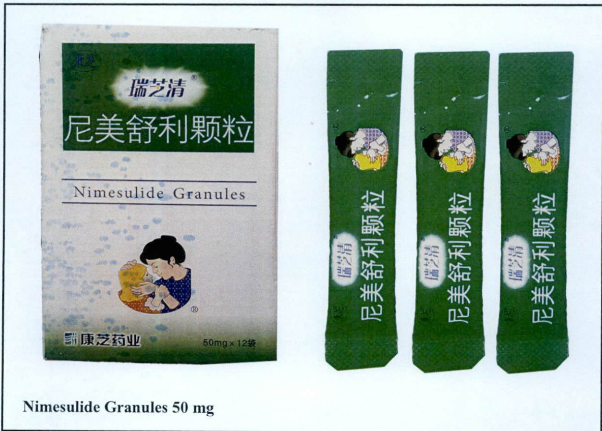
Nimesulide Granules 50 mg

Pinapayuhan ng Food and Drug Administration (FDA) ang publiko laban sa pagbili at paggamit ng mga sumusunod na hindi rehistradong gamot: