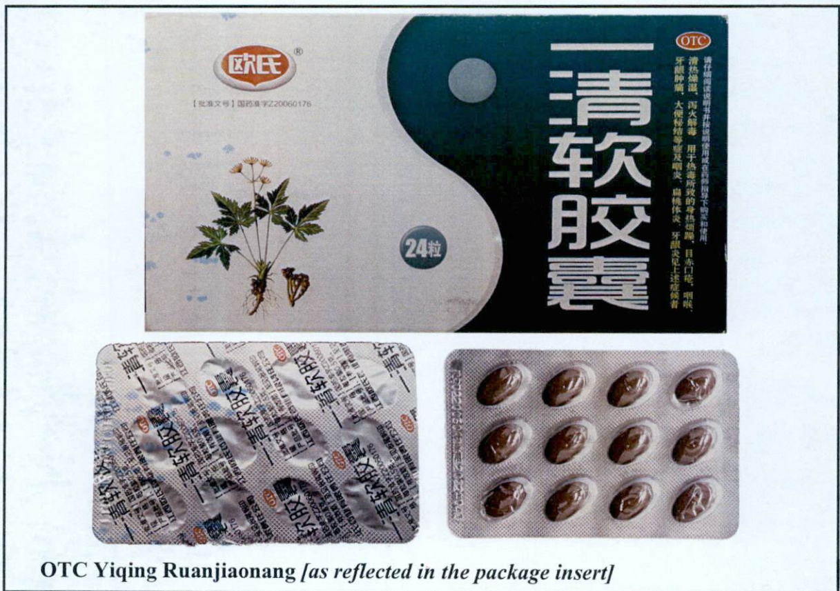
OTC Yiqing Ruanjiaonang [as reflected in the package insert]