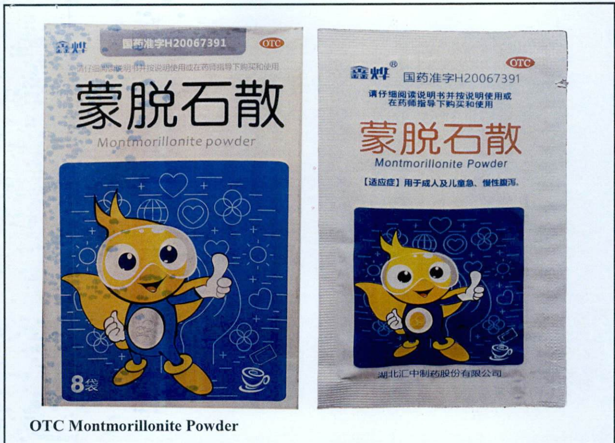
OTC Montmorillonite Powder