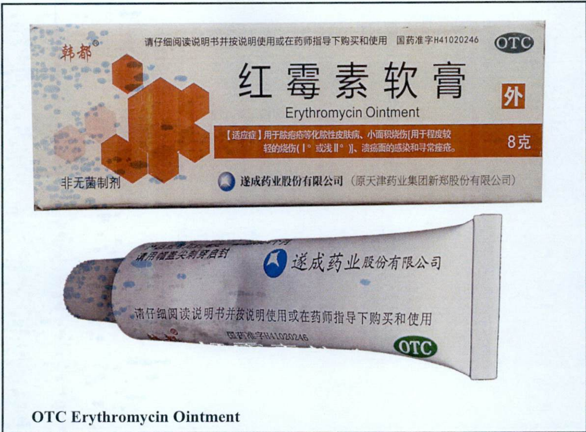
OTC Erythromycin Ointment