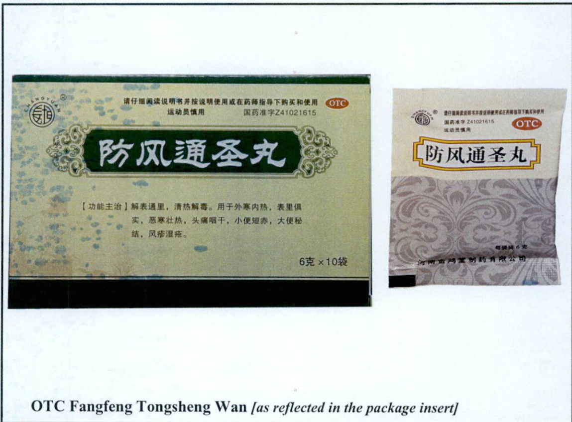
OTC Fangfeng Tongsheng Wan [as reflected in the package insert]