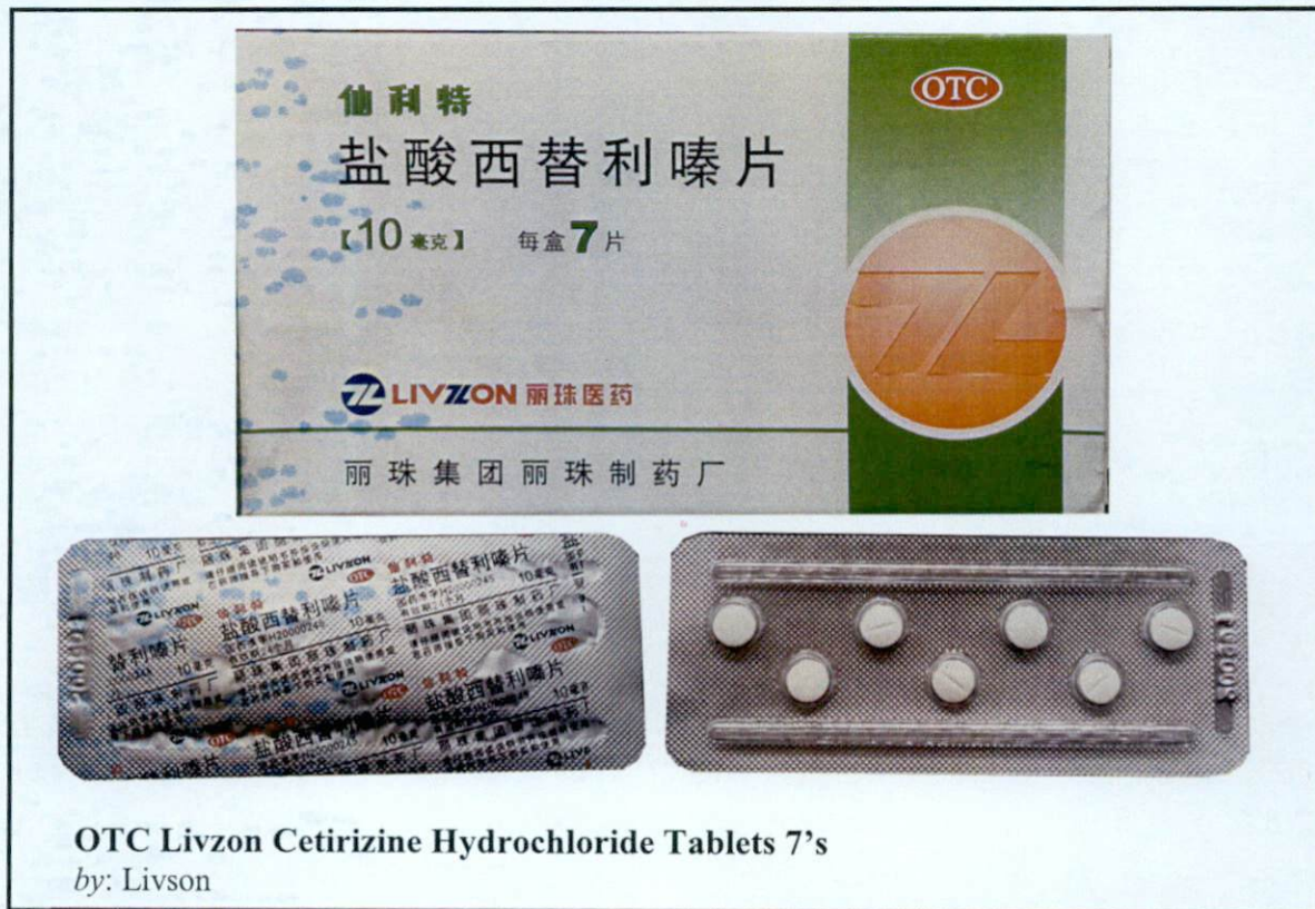
OTC Livzon Cetirizine Hydrochloride Tablets 7's by: Livson

Pinapayuhan ng Food and Drug Administration (FDA) ang publiko laban sa pagbili at paggamit ng mga sumusunod na hindi rehistradong gamot: