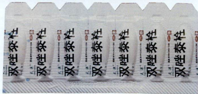
OTC Metronidazole, Clotrimazole and Chlorhexidine Acetate Suppositories Shuangzuotai Shuan [as reflected in the package insert]