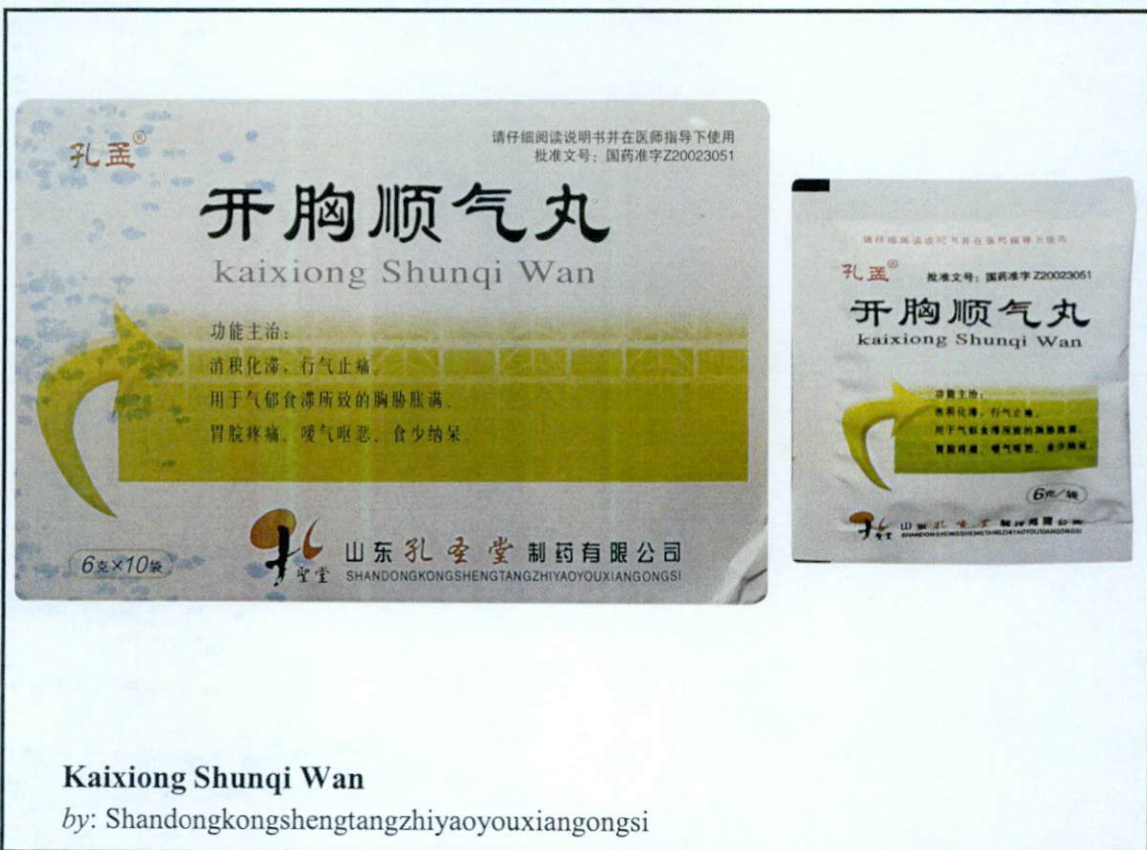
Larawan 5. Hindi rehistradong gamot