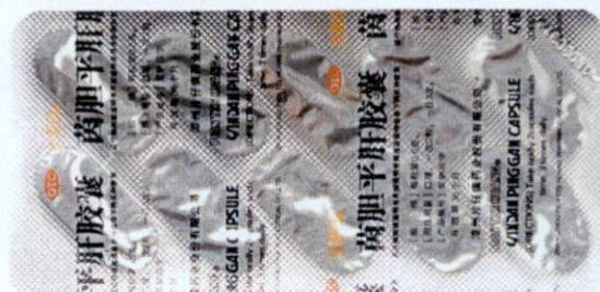
OTC Pien Tze Huang® Yindan Pinggan Capsule by: Zhangzhou Pien Tze Huang Pharmaceutical Co., Ltd.