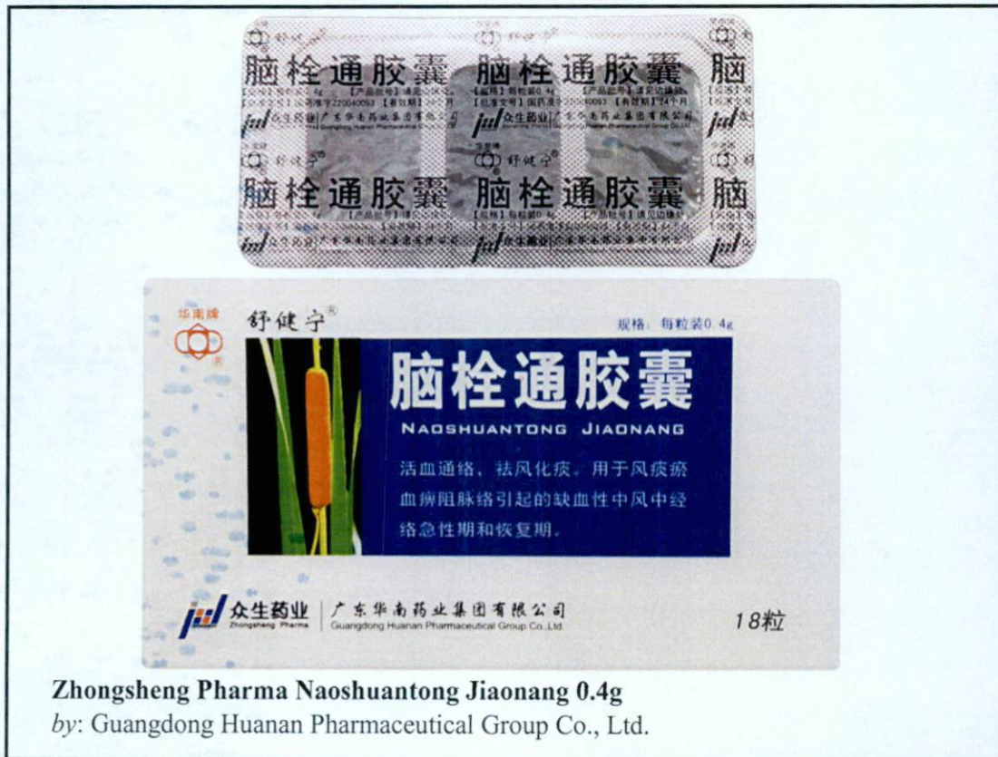
Zhongsheng Pharma Naoshuantong Jiaonang 0.4g by: Guangdong Huanan Pharmaceutical Group Co., Ltd.

Pinapayuhan ng Food and Drug Administration (FDA) ang publiko laban sa pagbili at paggamit ng mga sumusunod na hindi rehistradong gamot: