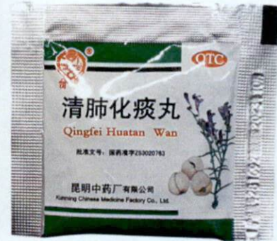
OTC Qingfei Huatan Wan by: Kunming Chinese Medicine Factory Co., Ltd.