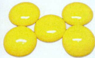
OTC XINFENG YAOYE Fufang Yuxingcao Pian