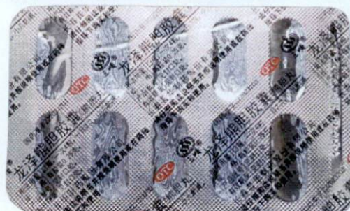
OTC Longze Xiongdan Jiaonang