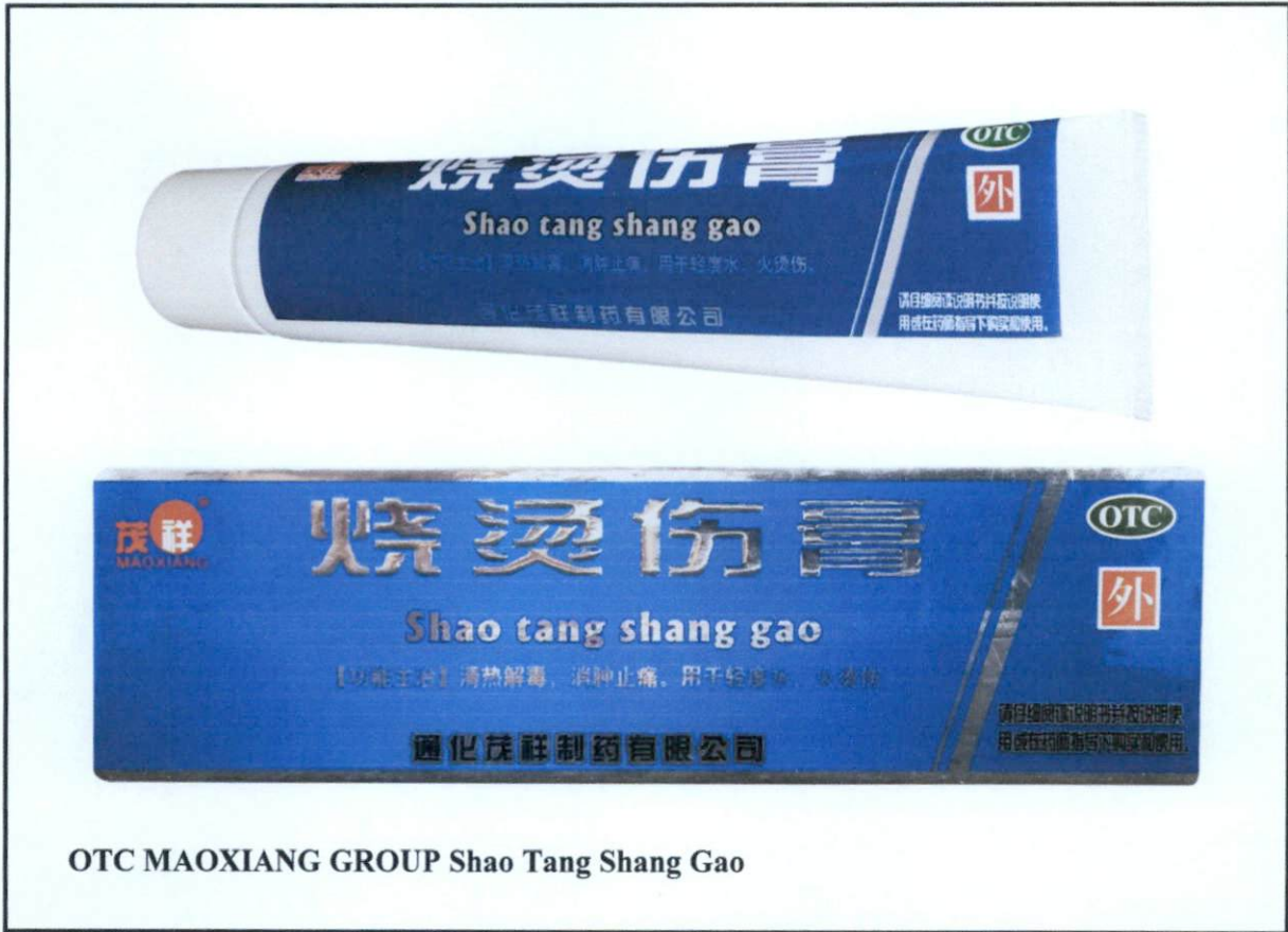
Larawan 4. Hindi rehistradong gamot