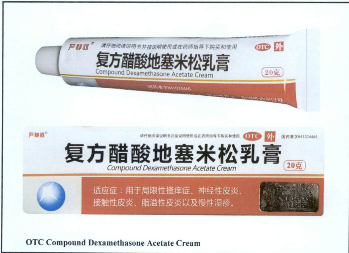
Larawan 5. Hindi rehistradong gamot