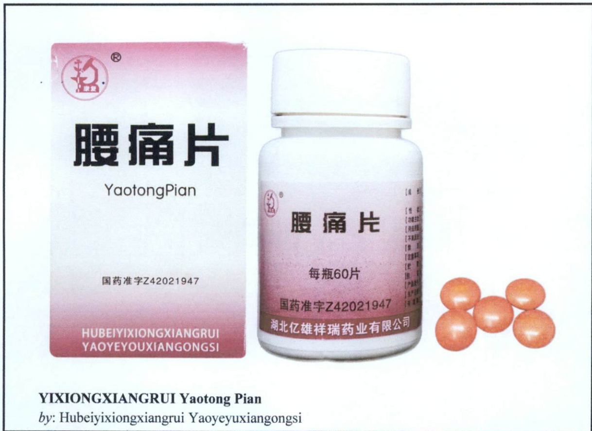
Larawan 2. Hindi rehistradong gamot