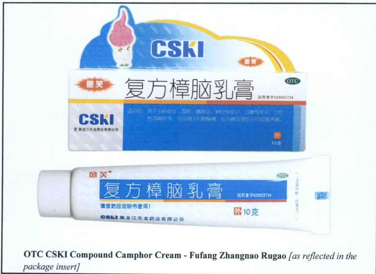
Larawan 3. Hindi rehistradong gamot