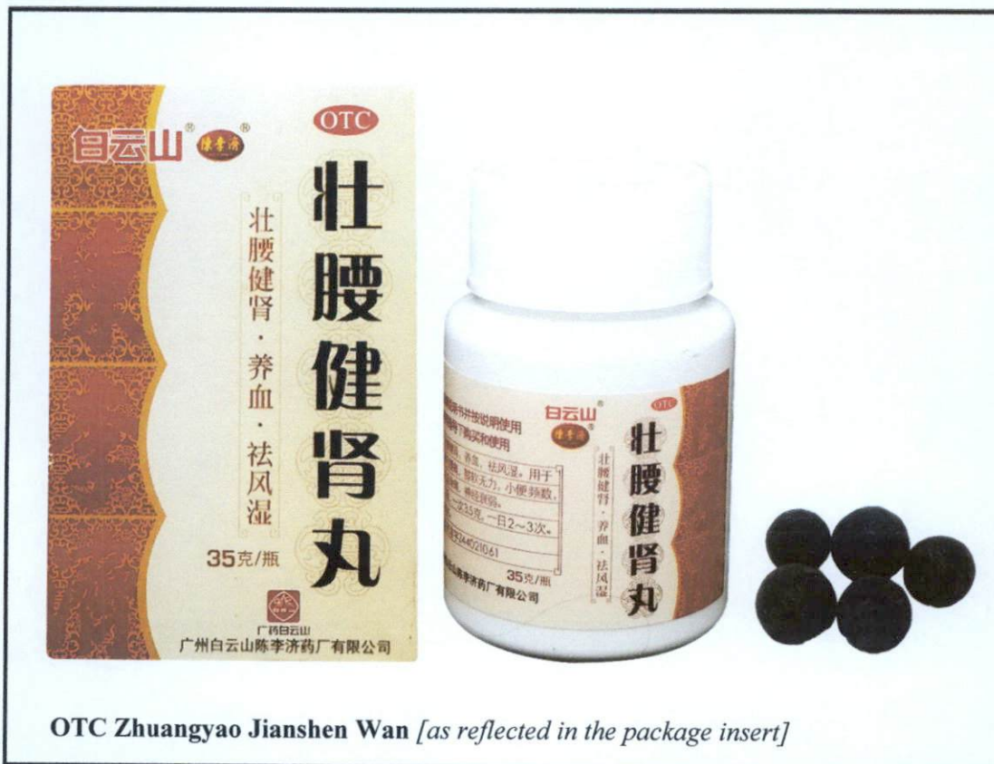
Larawan 1. Hindi rehistradong gamot

Pinapayuhan ng Food and Drug Administration (FDA) ang publiko laban sa pagbili at paggamit ng mga sumusunod na hindi rehistradong gamot: