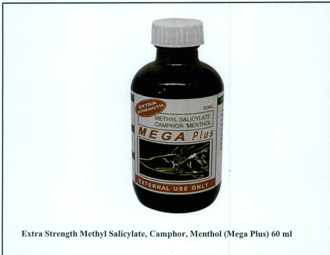
Extra Strength Methyl Salicylate, Camphor, Menthol (Mega Plus) 60 ml

Pinapayuhan ng Food and Drug Administration (FDA) ang publiko laban sa pagbili at paggamit ng hindi rehistradong gamot na: