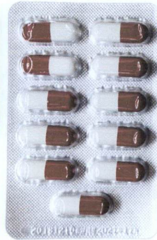
OTC Qianlie Shule Jiaonang