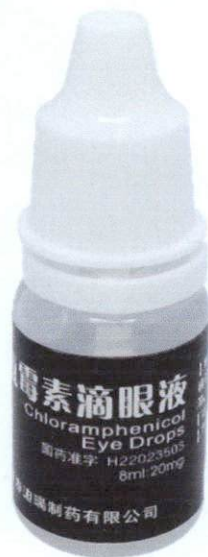
Chloramphenicol Eye Drops 8ml:20mg