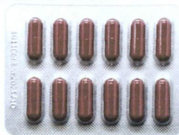
OTC Huoxue Zhitong Jiaonang [as reflected in the package insert] by: Jiangxi Baishen Changnuo Medicine Co., Ltd.