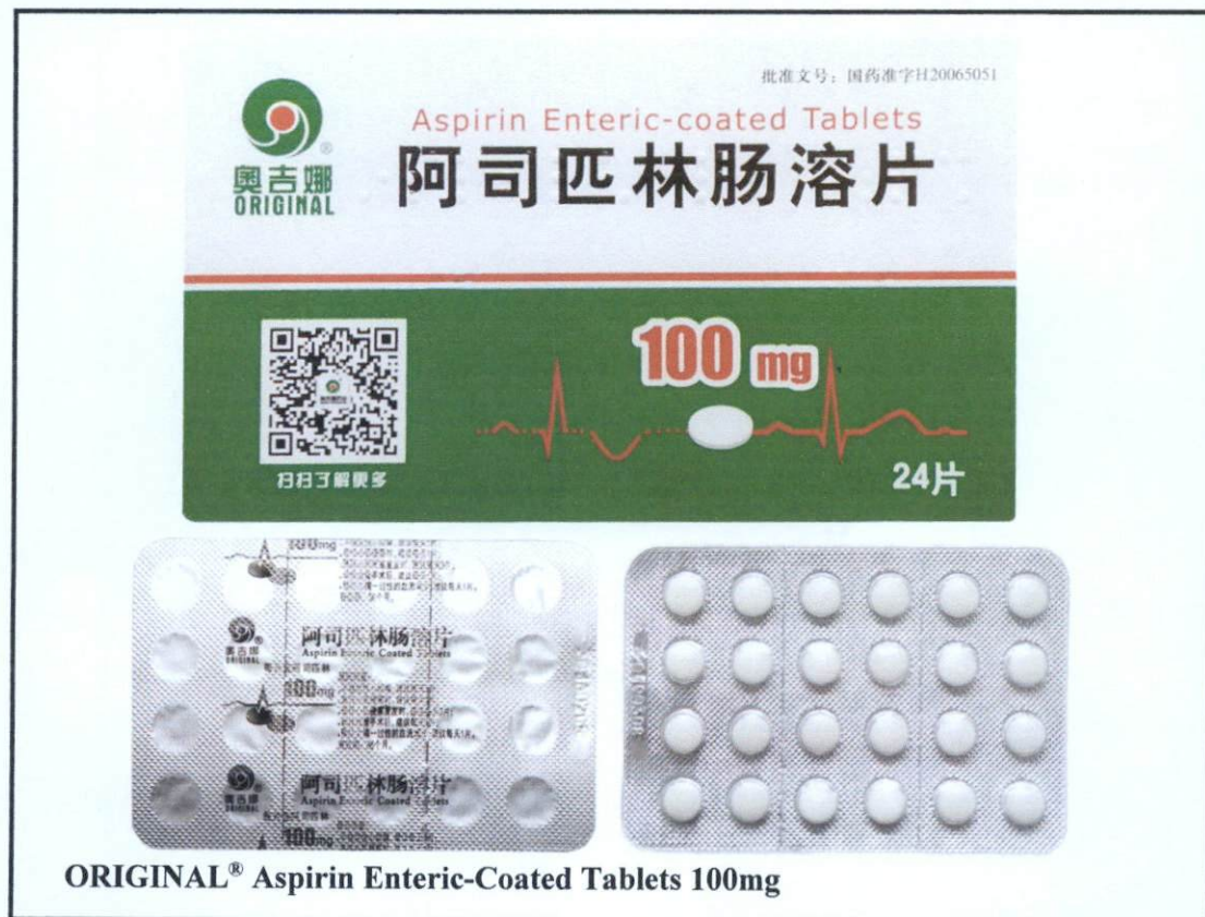
Larawan 1. Hindi rehistradong gamot

Pinapayuhan ng Food and Drug Administration (FDA) ang publiko laban sa pagbili at paggamit ng mga sumusunod na hindi rehistradong gamot: