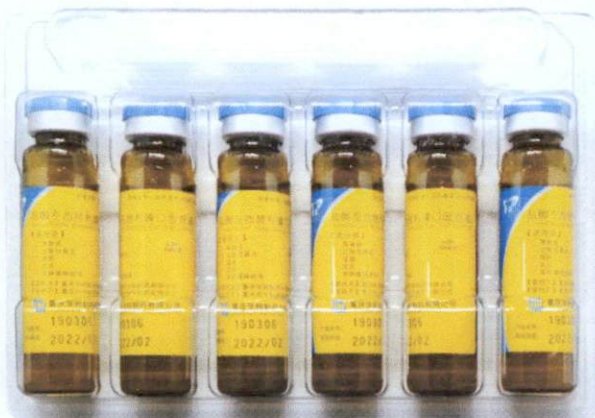
Levocetirizine Hydrochloride Oral Solution 0.05% by: Chongqing Huapont Pharm Co., Ltd.