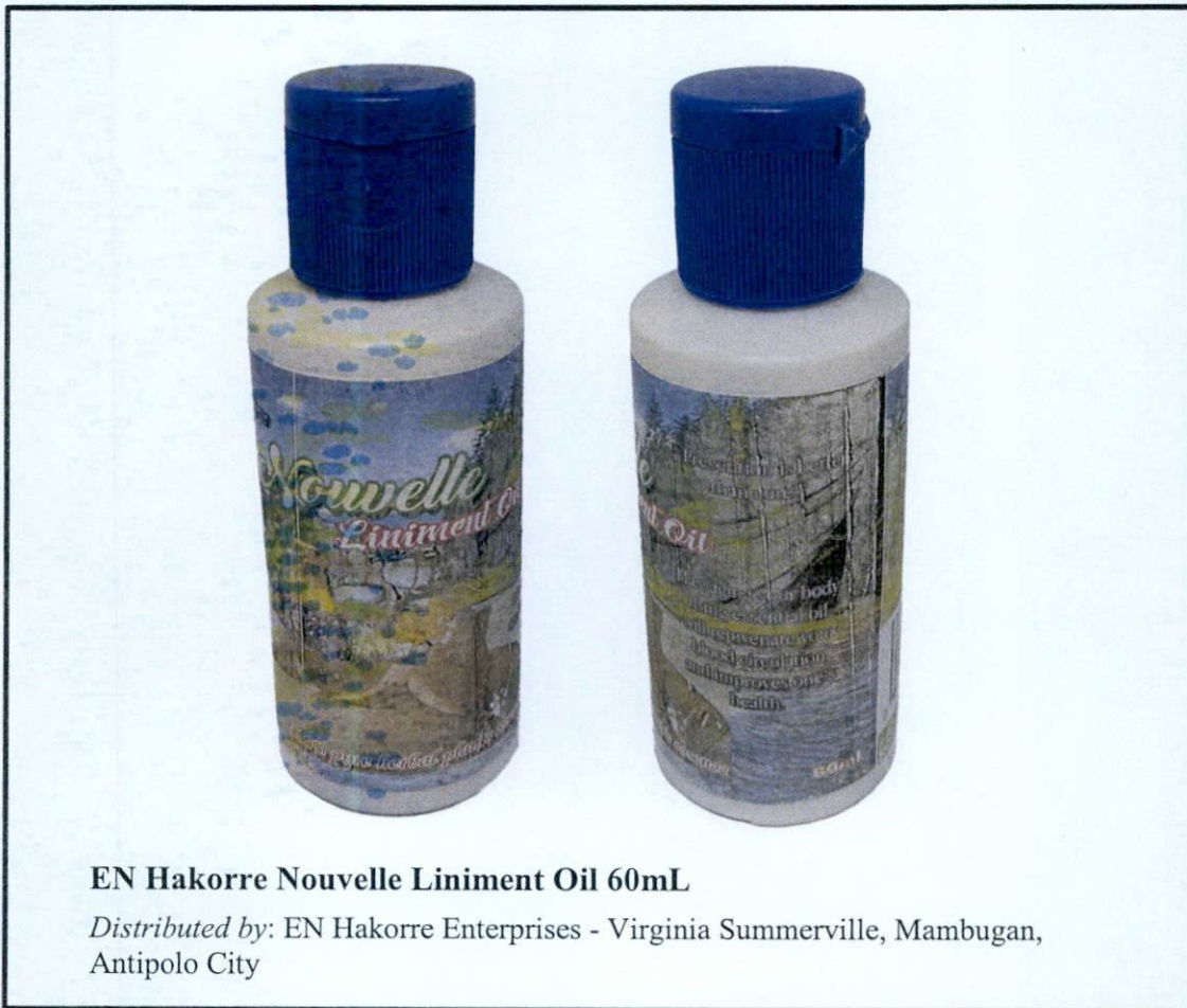
EN Hakorre Nouvelle Liniment Oil 60mL

Pinapayuhan ng Food and Drug Administration (FDA) ang publiko laban sa pagbili at paggamit ng hindi rehistradong gamot na: