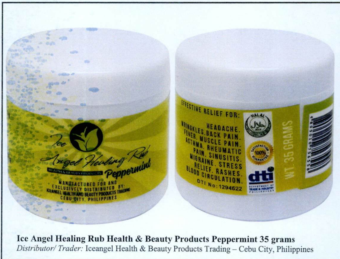
Ice Angel Healing Rub Health & Beauty Products Peppermint 35 grams Distributor/ Trader: Iceangel Health & Beauty Products Trading – Cebu City, Philippines

Pinapayuhan ng Food and Drug Administration (FDA) ang publiko laban sa pagbili at paggamit ng mga sumusunod na hindi rehistradong gamot: