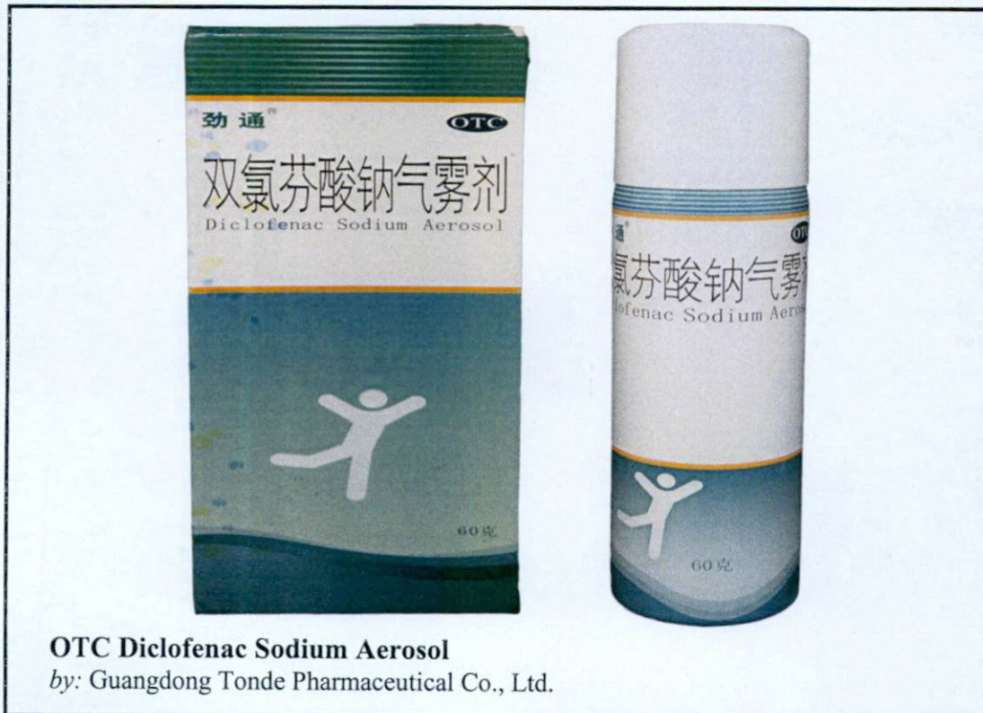
Larawan 1. Hindi rehistradong gamot

Pinapayuhan ng Food and Drug Administration (FDA) ang publiko laban sa pagbili at paggamit ng mga sumusunod na hindi rehistradong gamot: