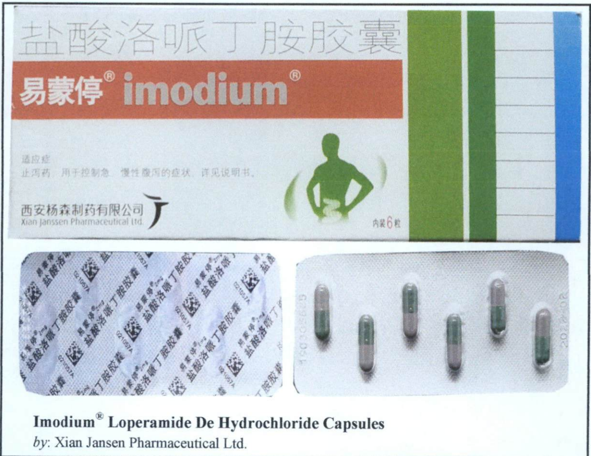
Larawan 5. Hindi rehistradong gamot