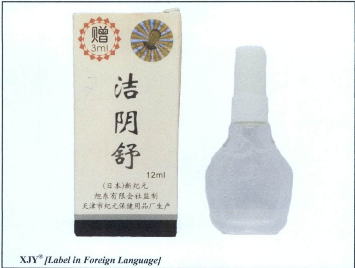
Larawan 4. Hindi rehistradong gamot