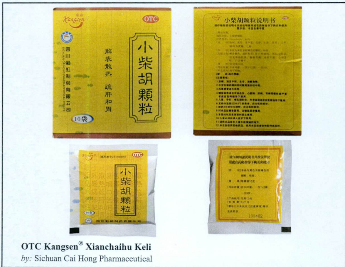
OTC Kangsen® Xianchihu Keli by: Sichuan Cai Hong Pharmaceutical