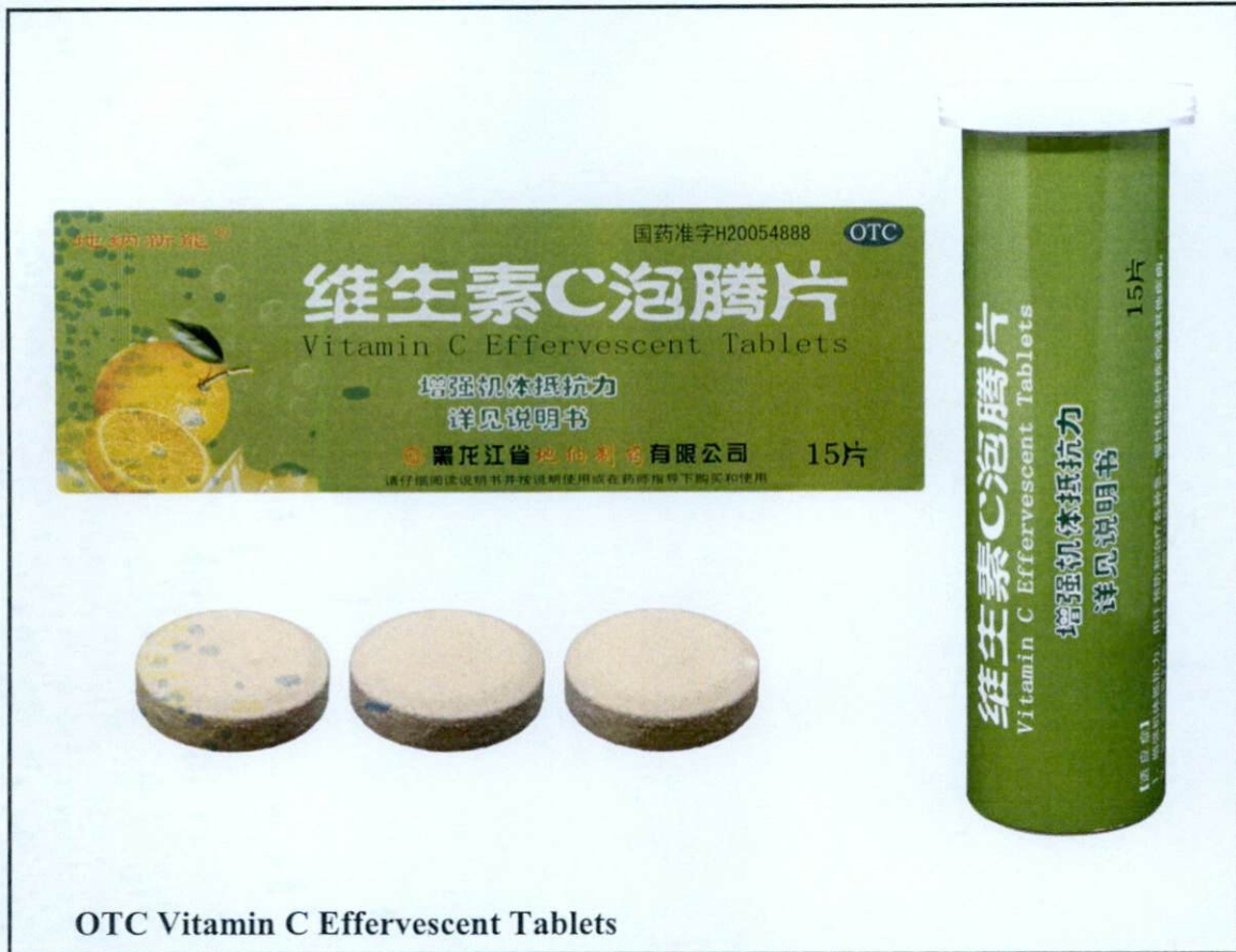
OTC Vitamin C Effervescent Tablets