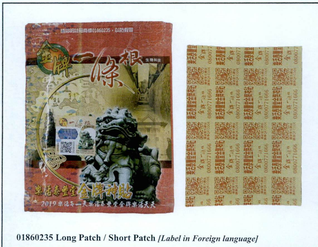
01860235 Long Patch / Short Patch [ Label in Foreign language ]

Pinapayuhan ng Food and Drug Administration (FDA) ang publiko laban sa pagbili at paggamit ng mga sumusunod na hindi rehistradong gamot: