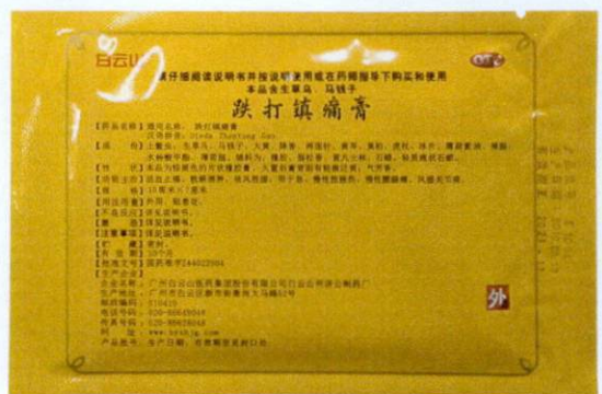
OTC "701" Dieda Zhentong Gao