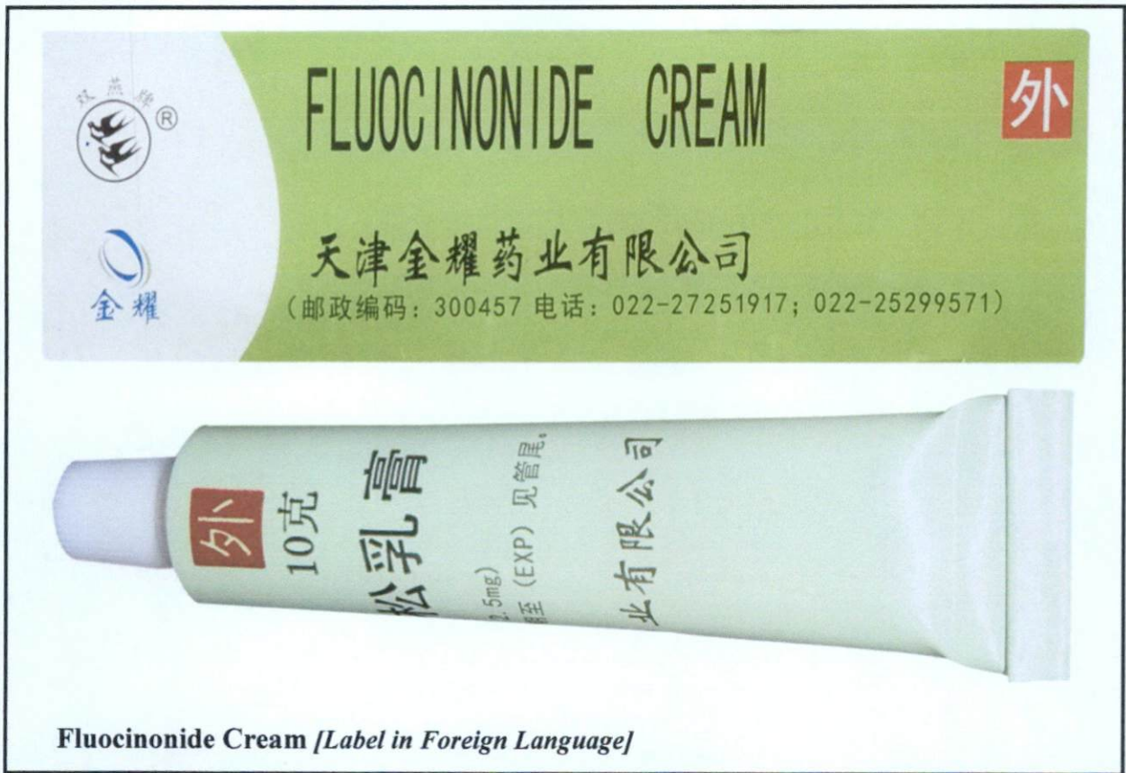
Fluocinonide Cream [Label in Foreign Language]