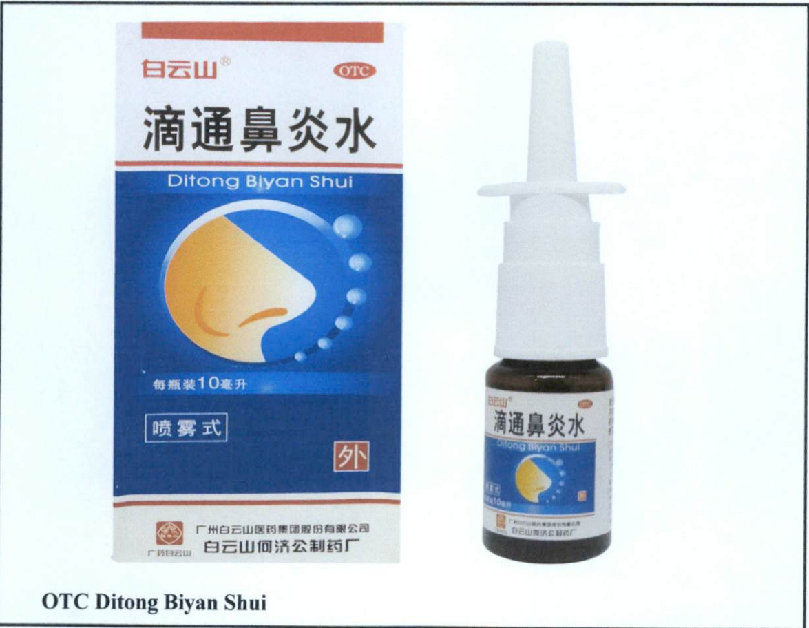
OTC Ditong Biyan Shui