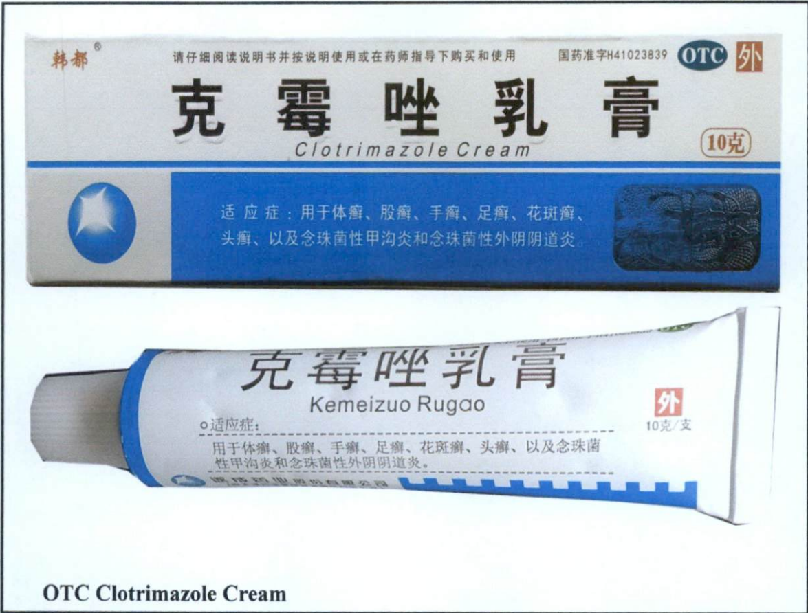
OTC Clotrimazole Cream