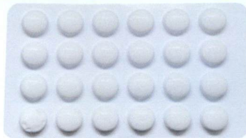
OTC Tankejing pian 24 Tablets

by: Jili Nba I Shanzhengmaoyaoyegufenyouxiangongs I