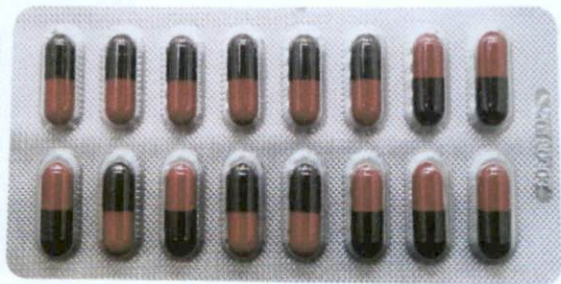
OTC Tongbianling Jiaonang [as reflected in package insert]