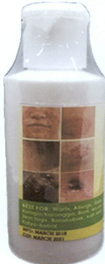
Kasoy Oil Enhanced Formula Anacardium Occidentale w/ Almond Oil 60 mL Manufacturer: Angel Touch

DIRECTIONS: Apply 3x-a-day (or as needed) - once a day to the affected area. INDICATIONS: Ringworm, Fungi, Dermatitis, Warts removal, Fungal skin infections. FAQ: What to expect when applying the Kasoy Oil? Expect stinging and burning sensation and redness around the area. KEEP OUT OF REACH OF CHILDREN - FOR EXTERNAL USE ONLY -