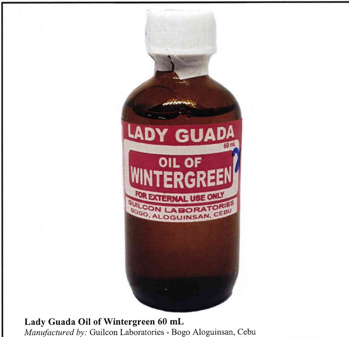
Lady Guada Oil of Wintergreen 60 mL

Pinapayuhan ng Food and Drug Administration (FDA) ang publiko laban sa pagbili at paggamit ng hindi rehistradong gamot na: