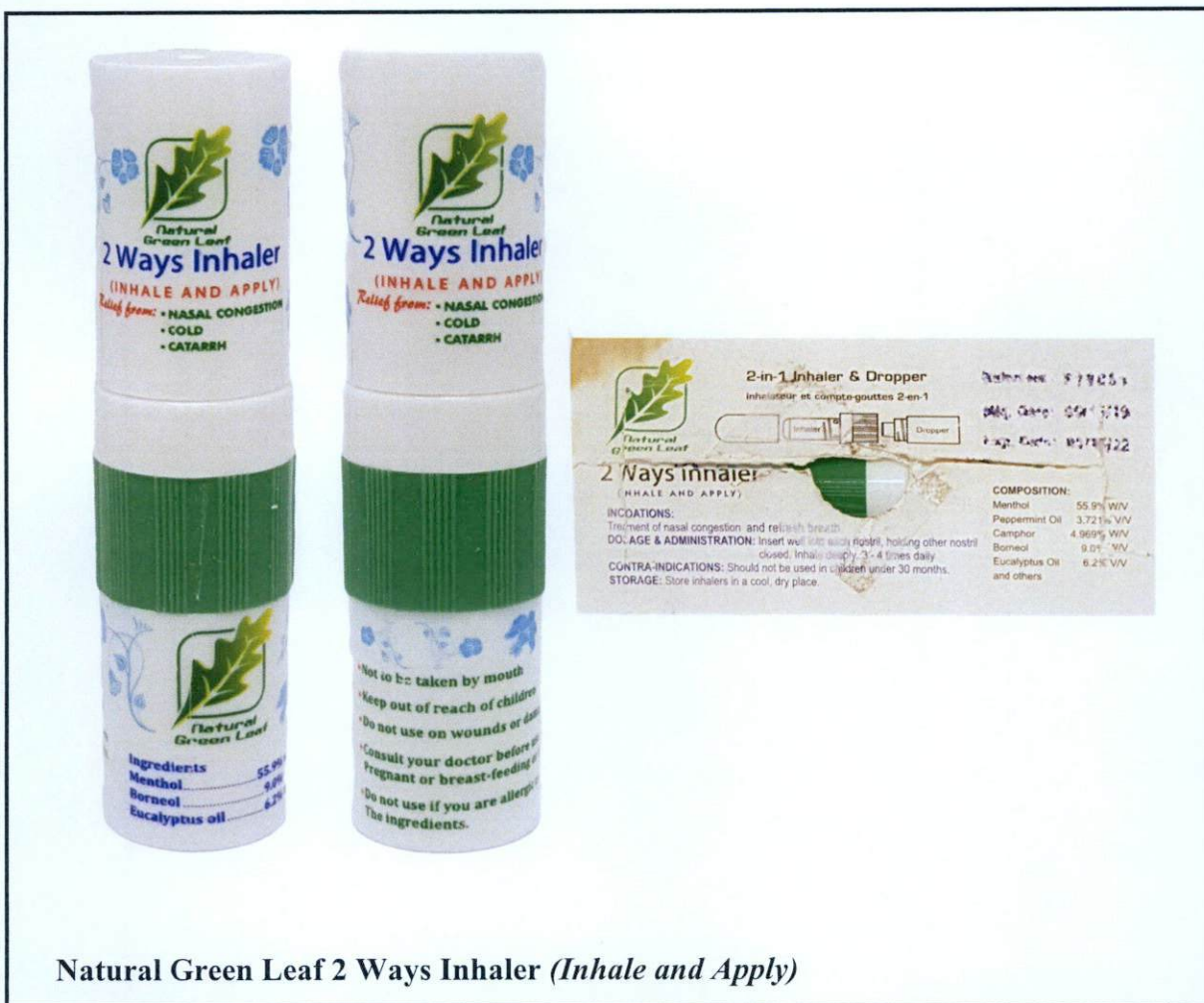
Natural Green Leaf 2 Ways Inhaler (Inhale and Apply)