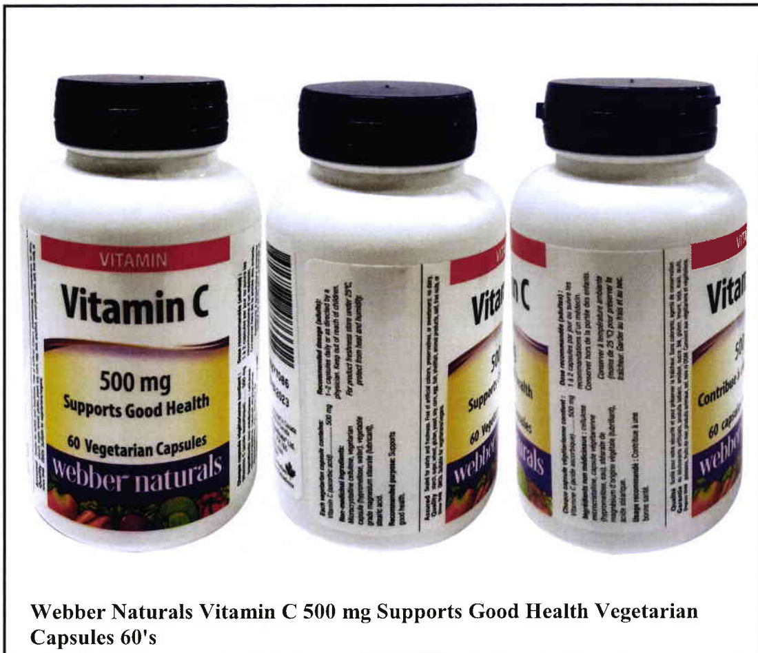
Webber Naturals Vitamin C 500 mg Supports Good Health Vegetarian Capsules 60's

Pinapayuhan ng Food and Drug Administration (FDA) ang publiko laban sa pagbili at paggamit ng mga sumusunod na hindi rehistradong gamot: