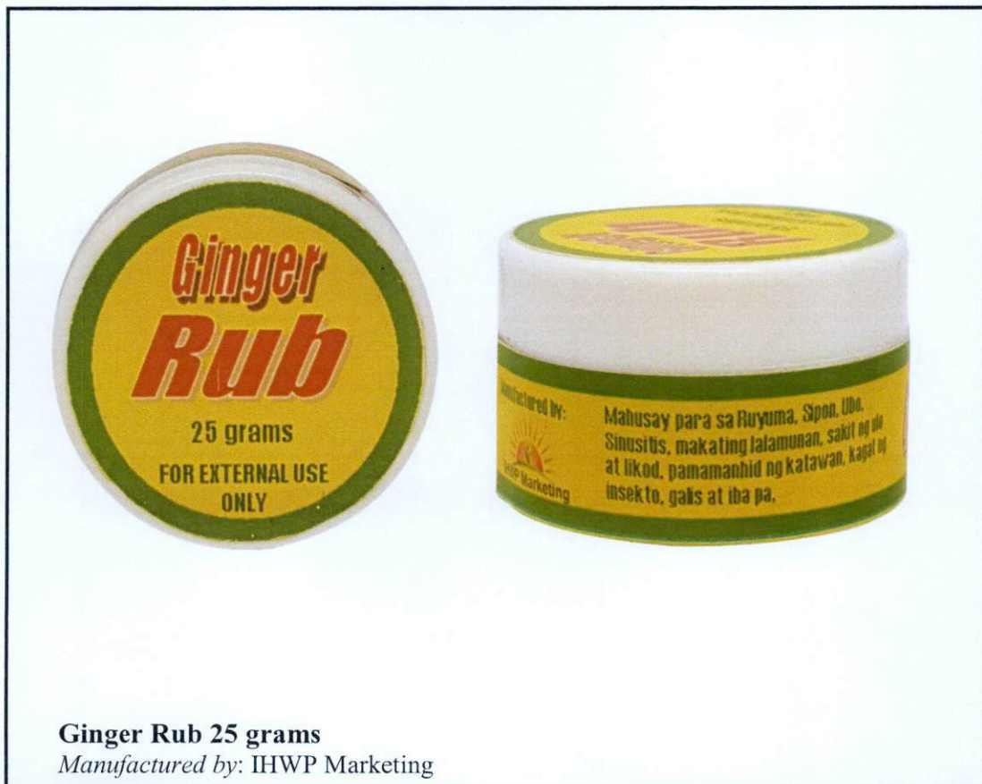
Ginger Rub 25 grams Manufactured by: IHWP Marketing

Pinapayuhan ng Food and Drug Administration (FDA) ang publiko laban sa pagbili at paggamit ng mga sumusunod na hindi rehiistradong gamot: