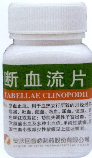
Tabellae Clinopodii 0.3g Tablets by: Anqing Huiyinbi Pharmaceutical Co., Ltd.