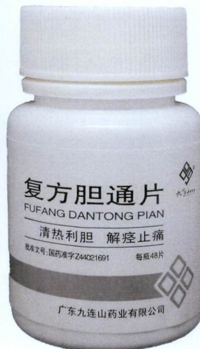
JIULIANGSHAN Fufang Dantong Pian by: Guangdong Jiuliangshan Pharmaceutical Co., Ltd.