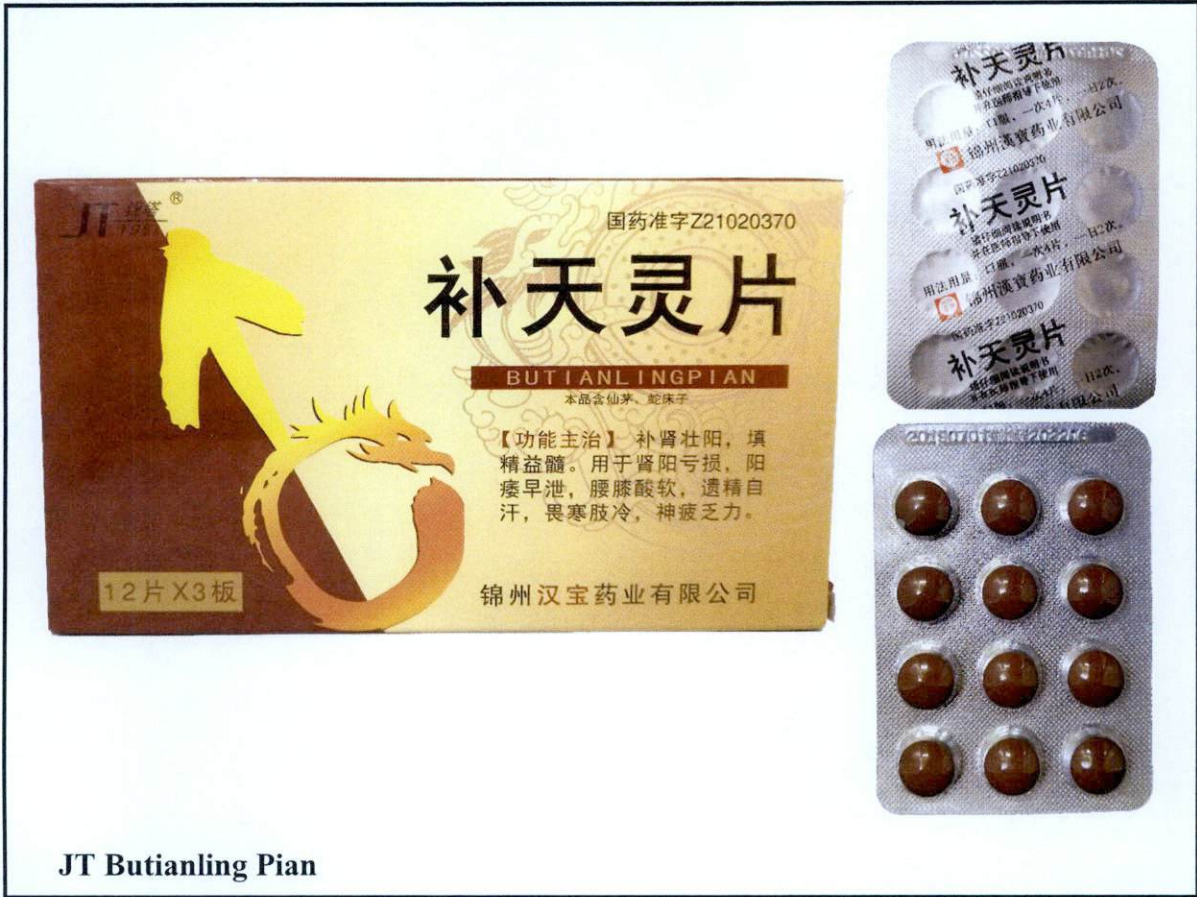
Larawan 3. Hindi rehistradong gamot