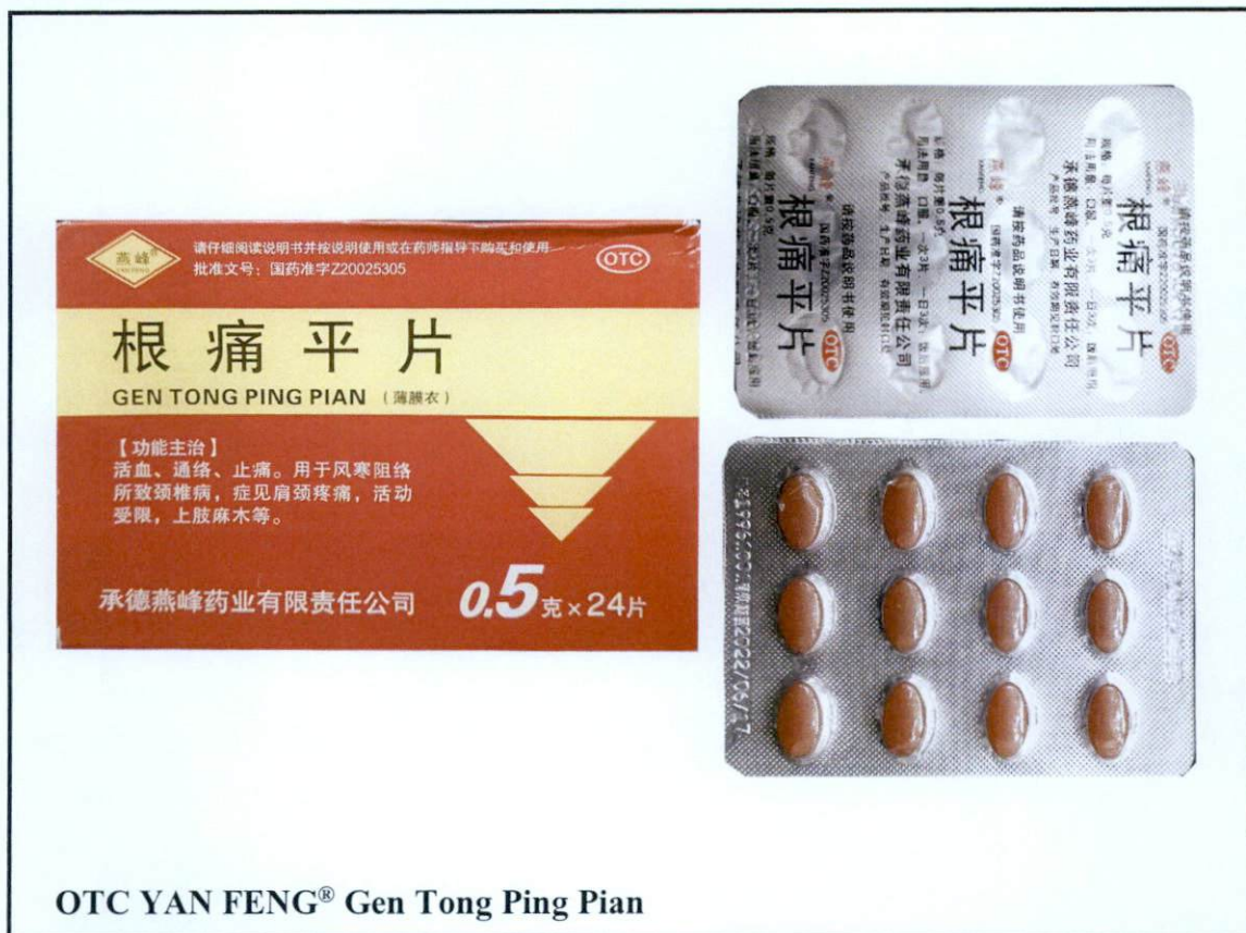
OTC YAN FENG® Gen Tong Ping Pian

Pinapayuhan ng Food and Drug Administration (FDA) ang publiko laban sa pagbili at paggamit ng mga sumusunod na hindi rehistradong gamot: