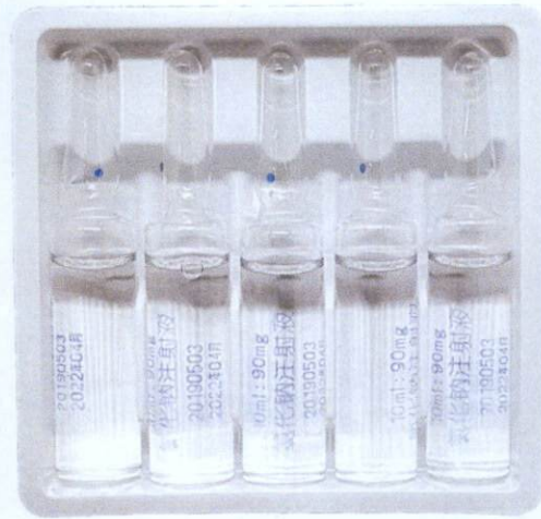
CHERISH Sodium Chloride Injection 10 mL: 90 mg