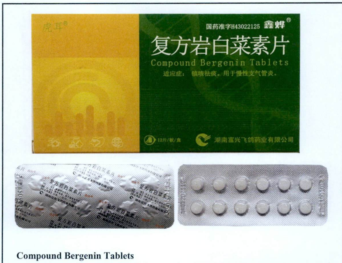
Compound Bergenin Tablets

Pinapayuhan ng Food and Drug Administration (FDA) ang publiko laban sa pagbili at paggamit ng mga sumusunod na hindi rehistradong gamot: