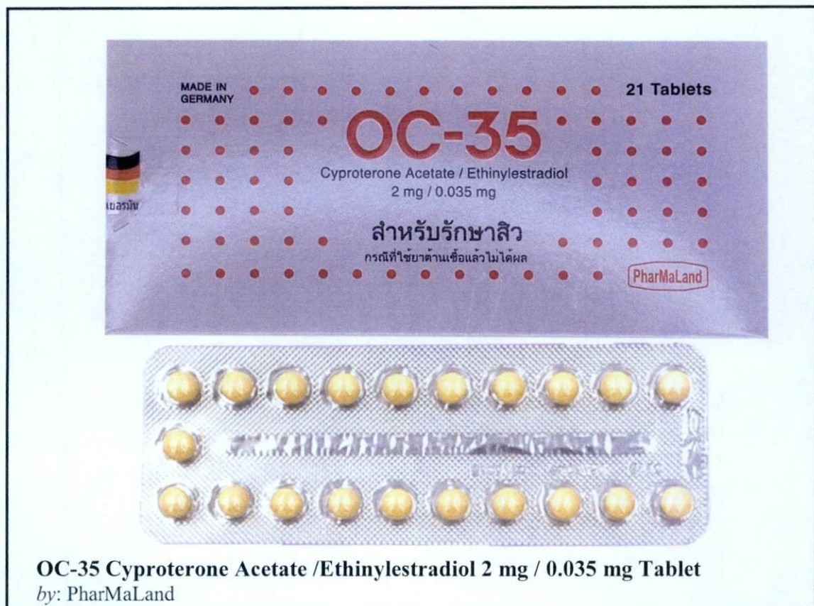
OC-35 Cyproterone Acetate /Ethinylestradiol 2 mg / 0.035 mg Tablet by: PharMaLand

Pinapayuhan ng Food and Drug Administration (FDA) ang publiko laban sa pagbili at paggamit ng mga sumusunod na hindi rehistradong gamot: