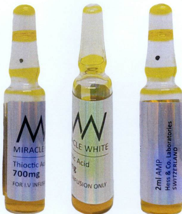
MW Miracle White Thioctic Acid 700 mg 2 mL Amp for IV Infusion Only by: Hess & Co. Laboratories - Switzerland