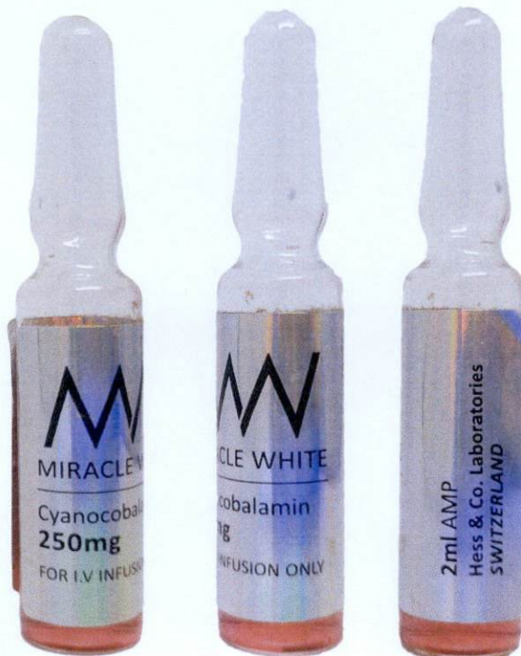
MW Miracle White Cyanocobalamin 250 mg 2 mL Amp for IV Infusion Only by: Hess & Co. Laboratories - Switzerland