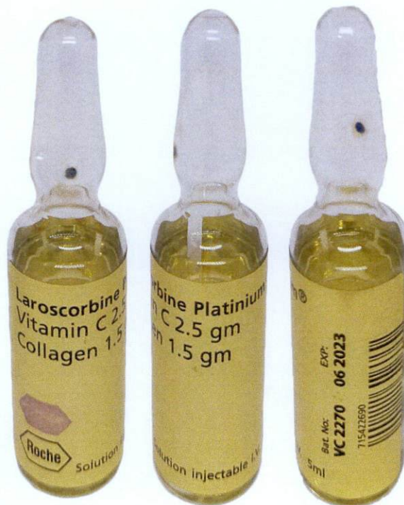
Laroscorbine Platinum ® Vitamin C 2.5 gm Collagen 1.5 gm Solution Injectable 5 mL by: Roche