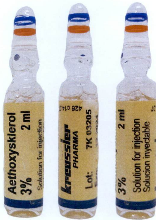
Aethoxysklerol 3% Solution for Injection 2 mL by: kreussler PHARMA