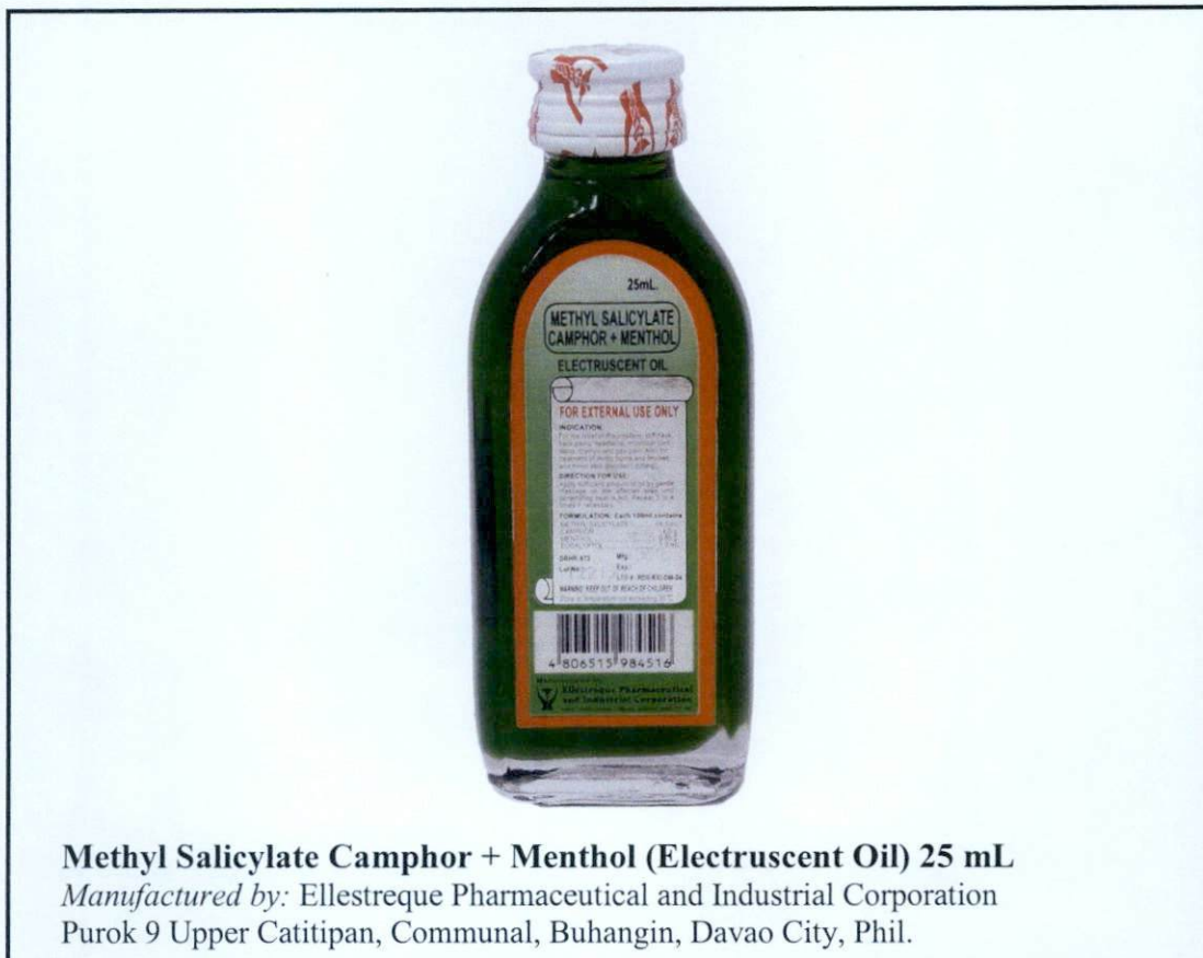
Methyl Salicylate Camphor + Menthol (Electruscent Oil) 25 mL Manufactured by: Ellestreque Pharmaceutical and Industrial Corporation Purok 9 Upper Catitipan, Communal, Buhangin, Davao City, Phil.

Pinapayuhan ng Food and Drug Administration (FDA) ang publiko laban sa pagbili at paggamit ng mga sumusunod na hindi rehistradong gamot: