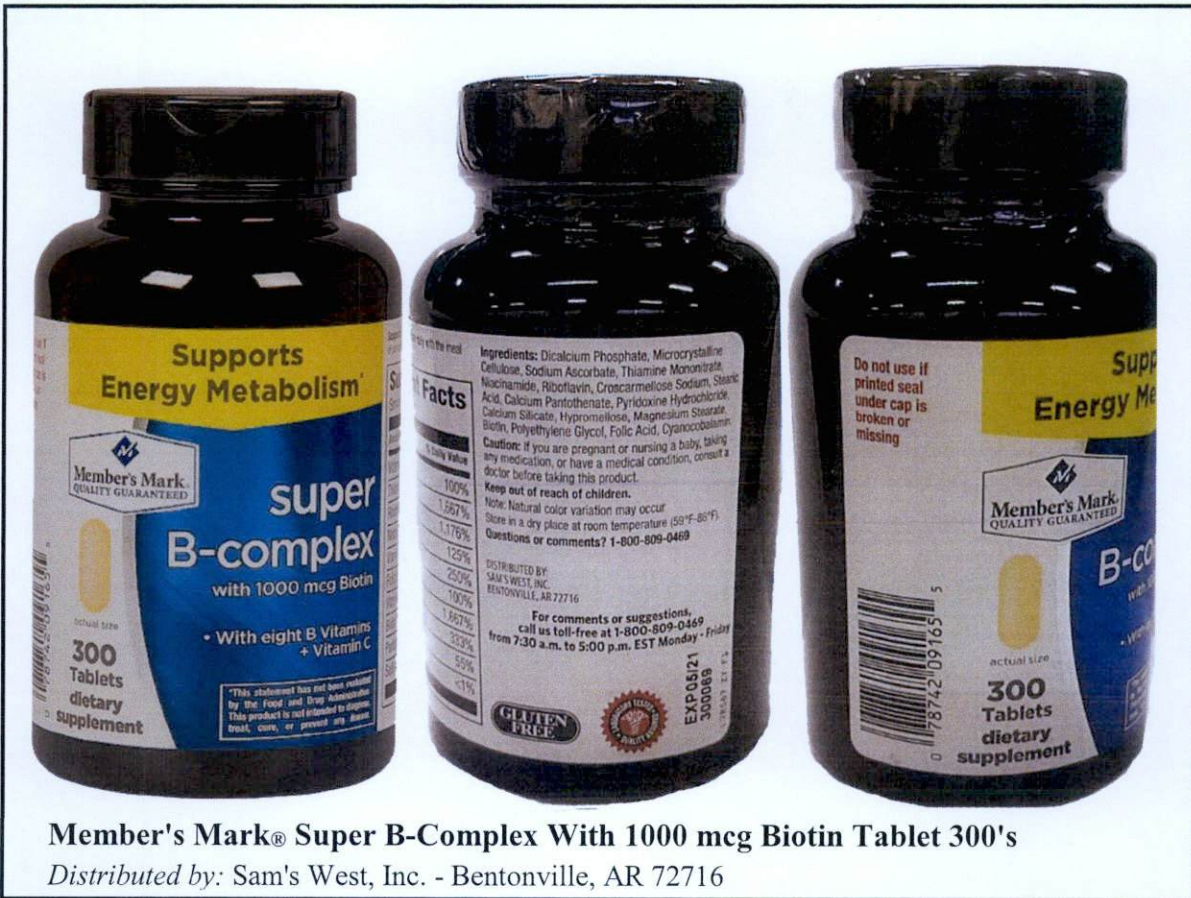
Larawan 3. Hindi rehistradong gamot