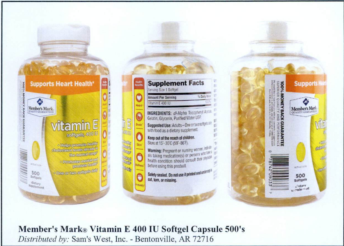
Larawan 2. Hindi rehistradong gamot