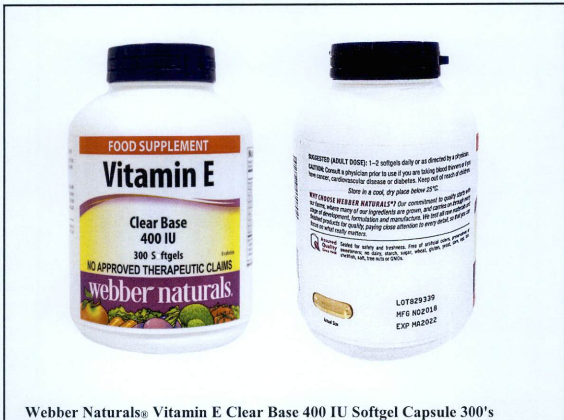
Webber Naturals® Vitamin E Clear Base 400 IU Softgel Capsule 300's

Pinapayuhan ng Food and Drug Administration (FDA) ang publiko laban sa pagbili at paggamit ng mga sumusunod na hindi rehistradong gamot: