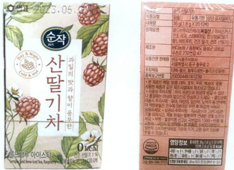
Figure 1. Unregistered SEMPIO Cold Brew Iced Tea Raspberry (In Foreign Language)

The Food and Drug Administration (FDA) warns all healthcare professionals and the general public NOT TO PURCHASE AND CONSUME the following unregistered food products: