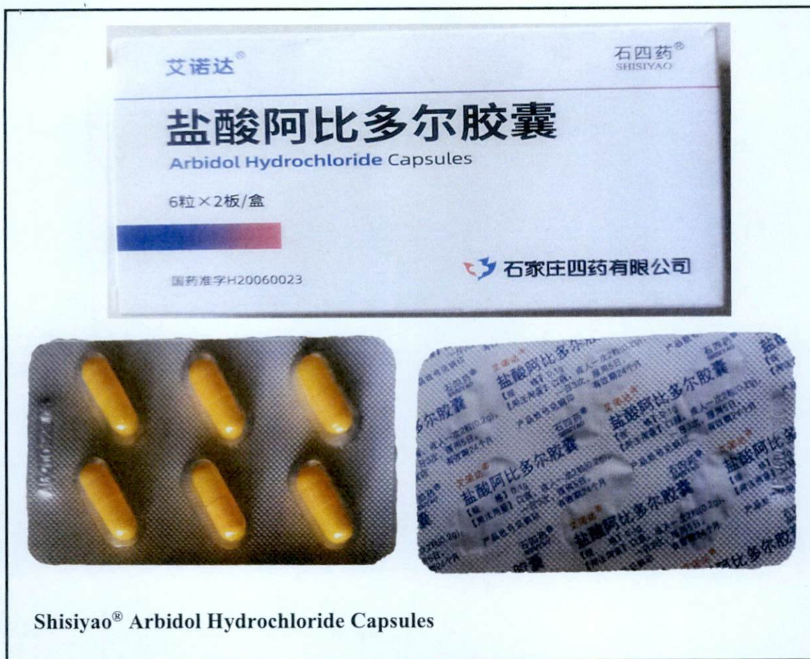
Shisiyao® Arbidol Hydrochloride Capsules