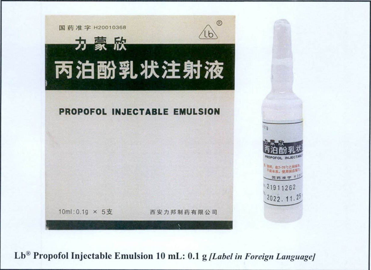
Lb® Propofol Injectable Emulsion 10 mL: 0.1 g [Label in Foreign Language]