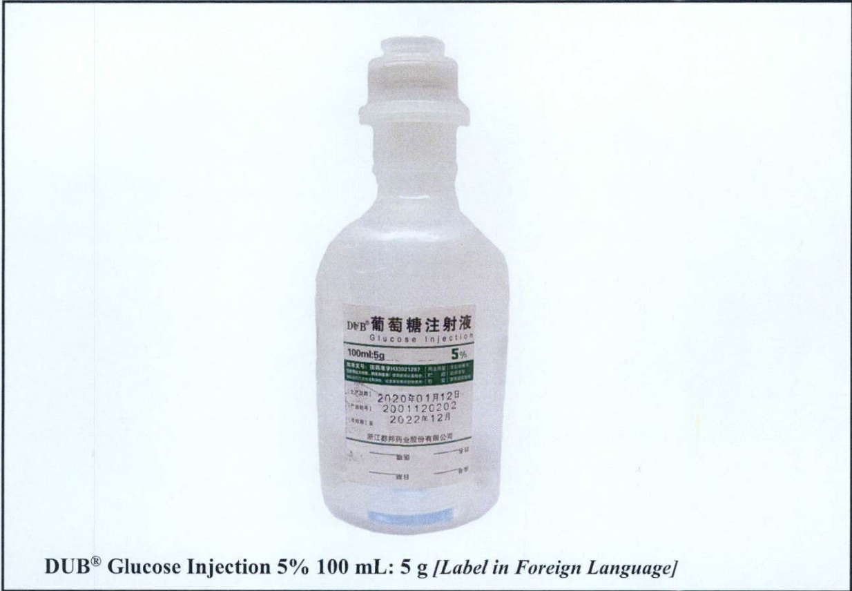
DUB® Glucose Injection 5% 100 mL: 5 g [Label in Foreign Language]