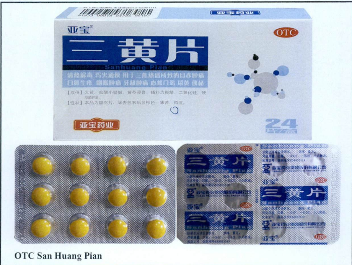
OTC San Huang Pian