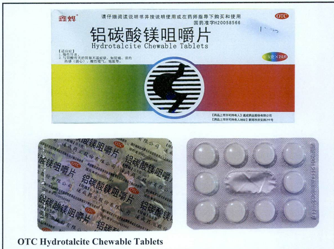
OTC Hydrotalcite Chewable Tablets

Pinapayuhan ng Food and Drug Administration (FDA) ang publiko laban sa pagbili at paggamit ng mga sumusunod na hindi rehistradong gamot: