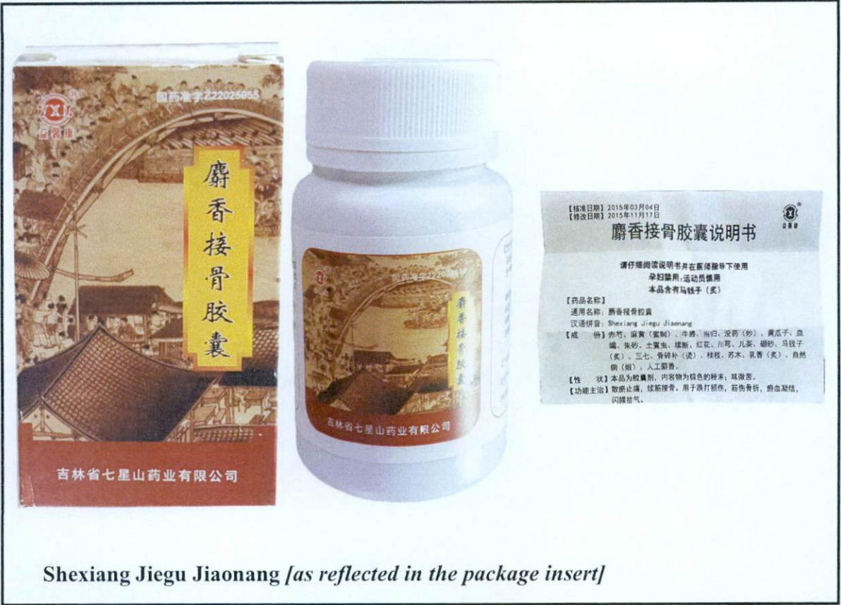
Shexiang Jiegu Jiaonang [as reflected in the package insert]