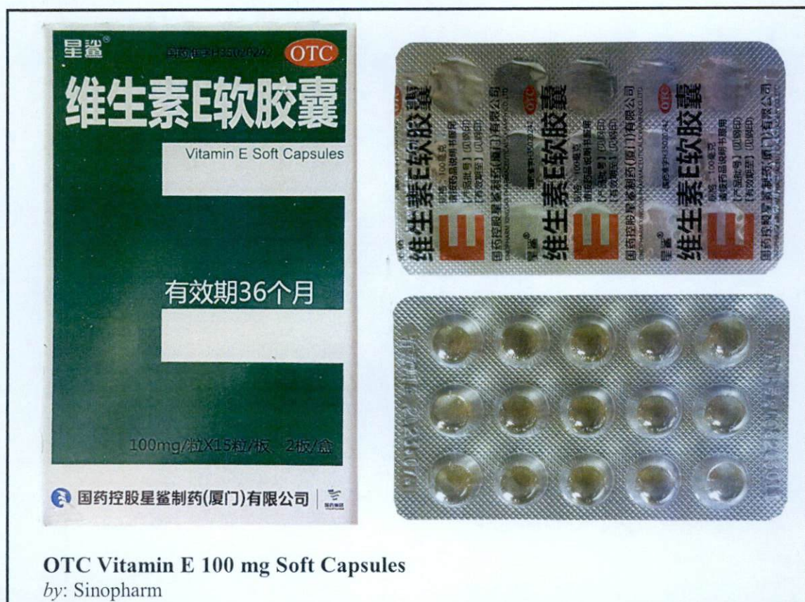
OTC Vitamin E 100 mg Soft Capsules by: Sinopharm

Pinapayuhan ng Food and Drug Administration (FDA) ang publiko laban sa pagbili at paggamit ng mga sumusunod na hindi rehistradong gamot: