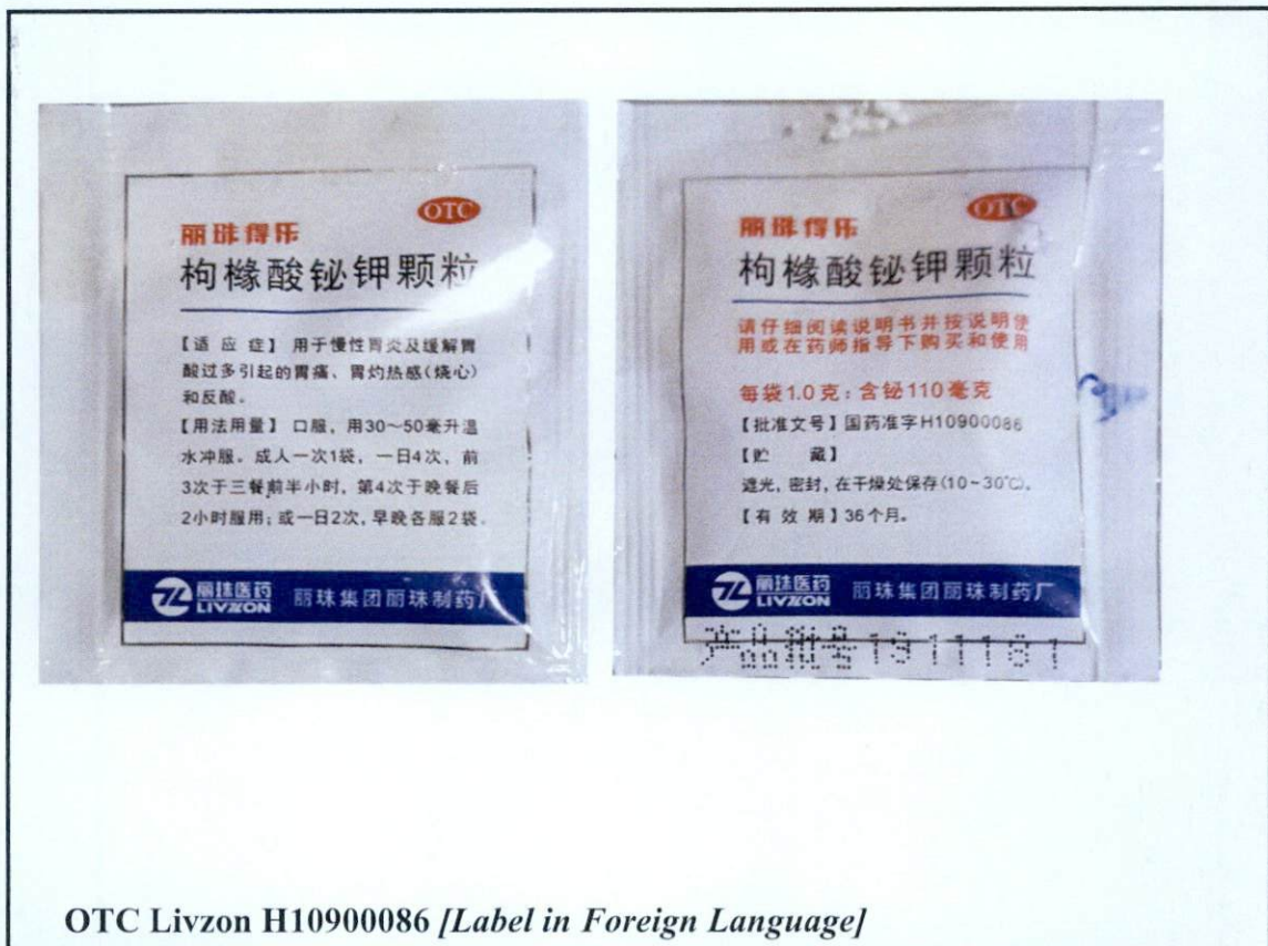
OTC Livzon H10900086 [ Label in Foreign Language ]

Pinapayuhan ng Food and Drug Administration (FDA) ang publiko laban sa pagbili at paggamit ng mga sumusunod na hindi rehistradong gamot: