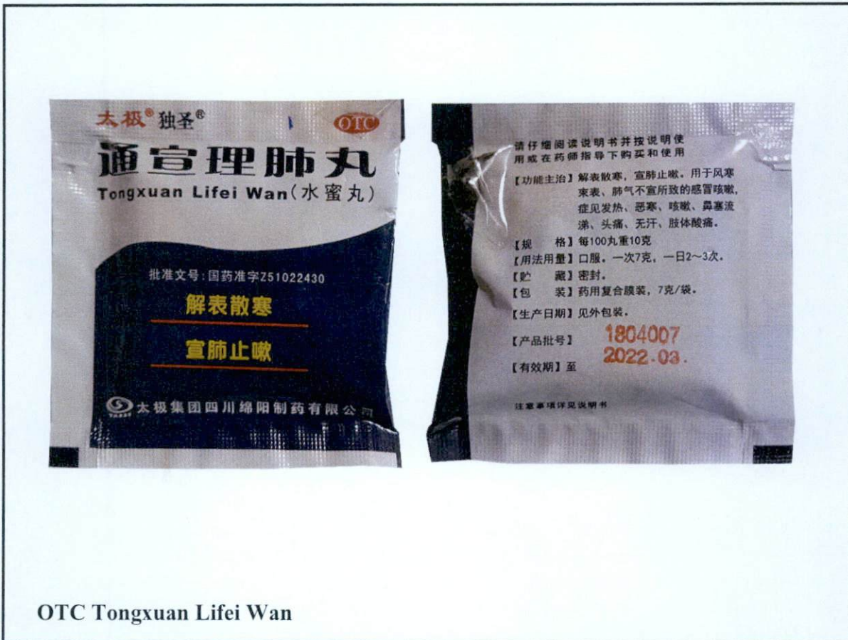
OTC Tongxuan Lifei Wan