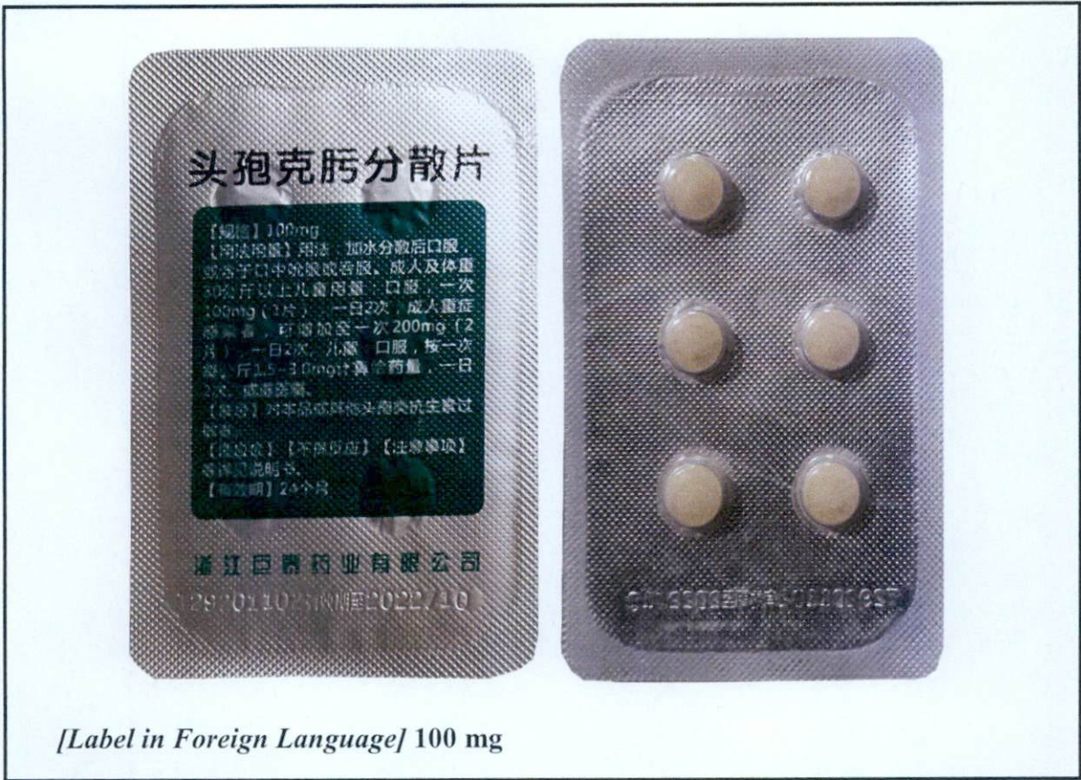
[Label in Foreign Language] 100 mg