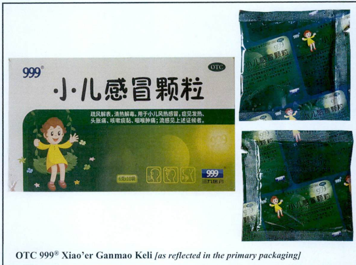
OTC 999® Xiao'er Ganmao Keli [as reflected in the primary packaging]

Pinapayuhan ng Food and Drug Administration (FDA) ang publiko laban sa pagbili at paggamit ng mga sumusunod na hindi rehistradong gamot: