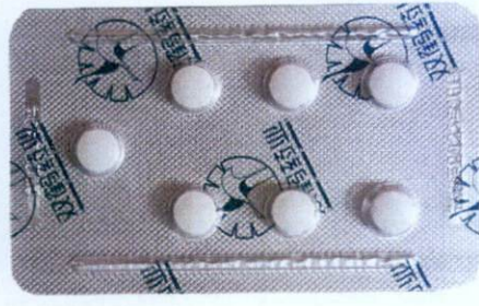
Rabeprazole Sodium 10 mg Enteric-coated Tablets