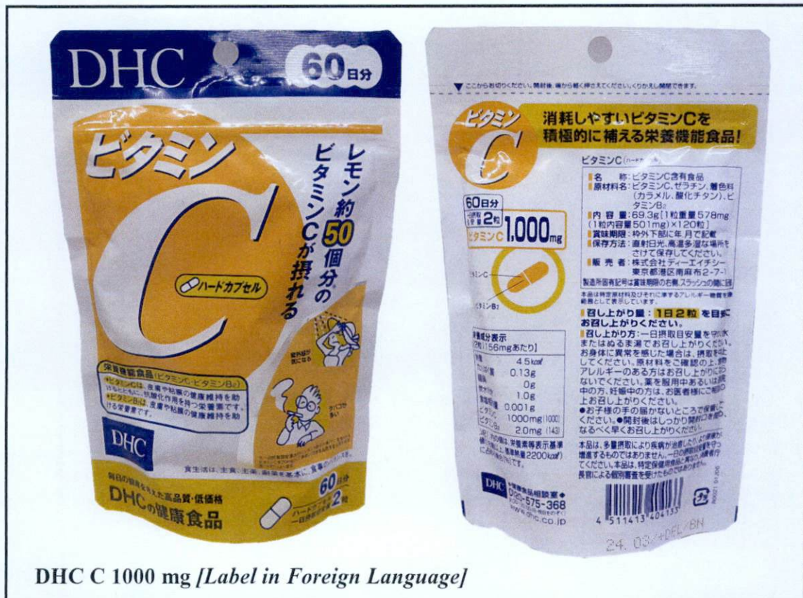
DHC C 1000 mg [Label in Foreign Language]

Pinapayuhan ng Food and Drug Administration (FDA) ang publiko laban sa pagbili at paggamit ng mga sumusunod na hindi rehistradong gamot: