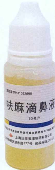
OTC Ephedrine Hydrochloride and Nitrofurazone Nasal Drops 10 mL by: Shanghai Winguide Huangpu Medicines and Chemical Reagents Products Co., Ltd. No. 777, Hongzhu Road, Fengxian, District, Shanghai