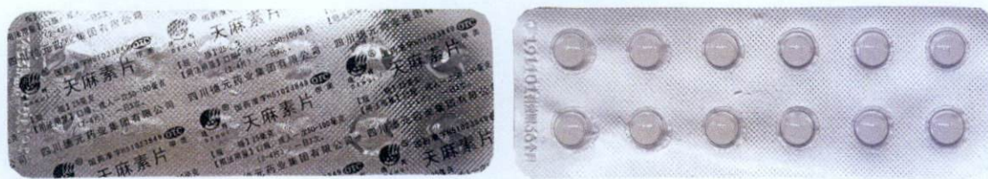
OTC DEHUI® Tian Ma Su Pian by: Sichuandeyuanyaojituanyouxiangongsi