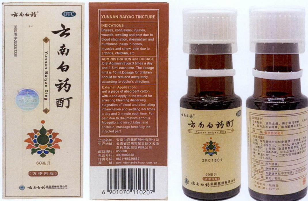
OTC Yunnan Baiyao Ding by: Yunnan Baiyao Group Co., Ltd.