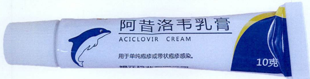
OTC Front Aciclovir Cream by: Front Pharmaceutical Plc.