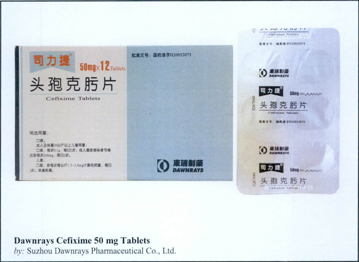
Dawnrays Cefixime 50 mg Tablets by: Suzhou Dawnrays Pharmaceutical Co., Ltd.