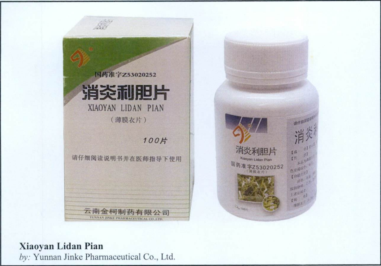
Xiaoyan Lidan Pian by: Yunnan Jinke Pharmaceutical Co., Ltd.