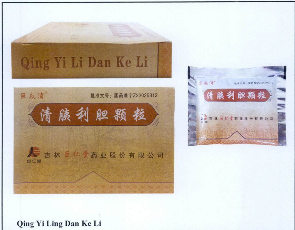
Qing Yi Ling Dan Ke Li

Pinapayuhan ng Food and Drug Administration (FDA) ang publiko laban sa pagbili at paggamit ng mga sumusunod na hindi rehistradong gamot: