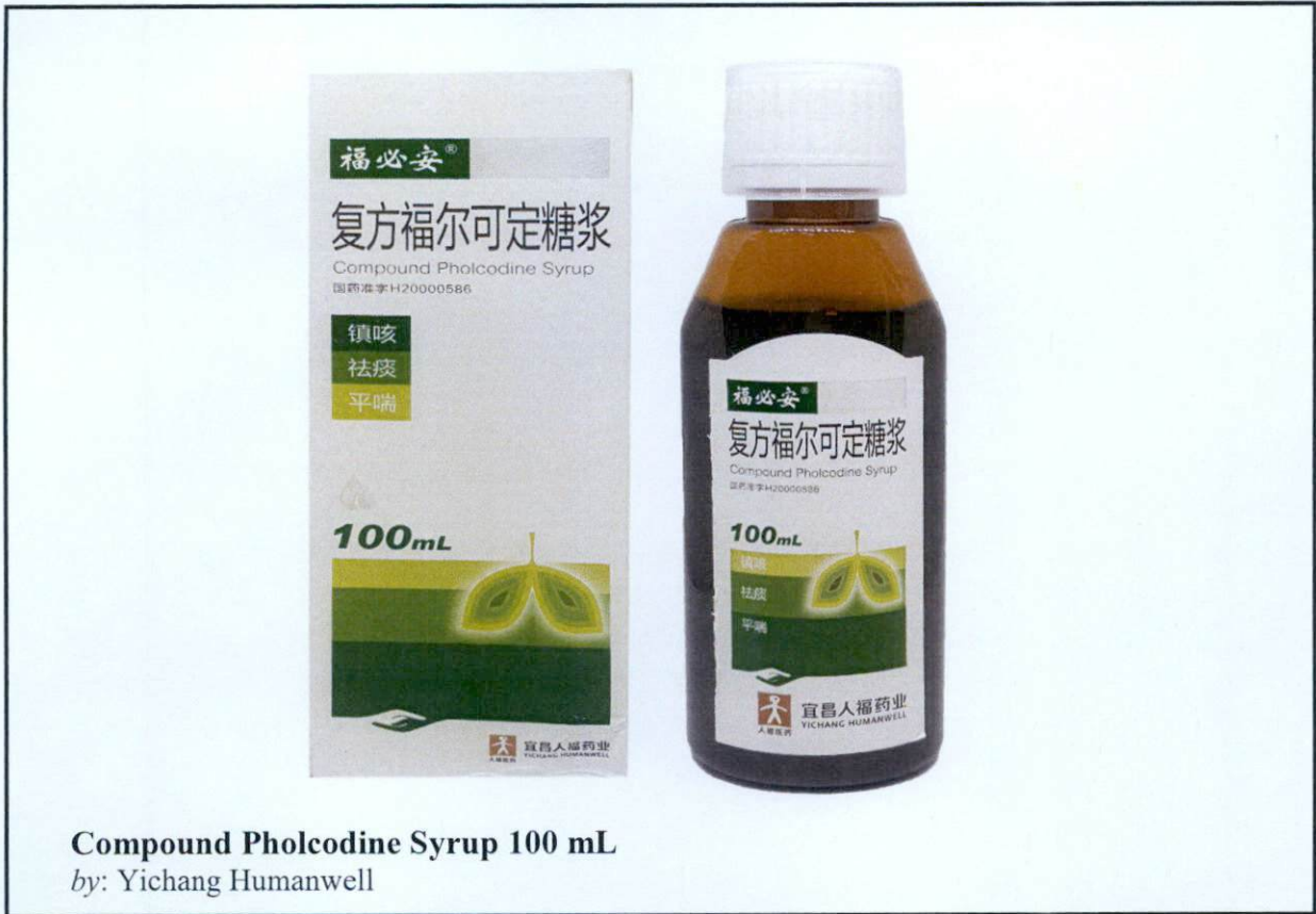
Compound Pholcodine Syrup 100 mL by: Yichang Humanwell