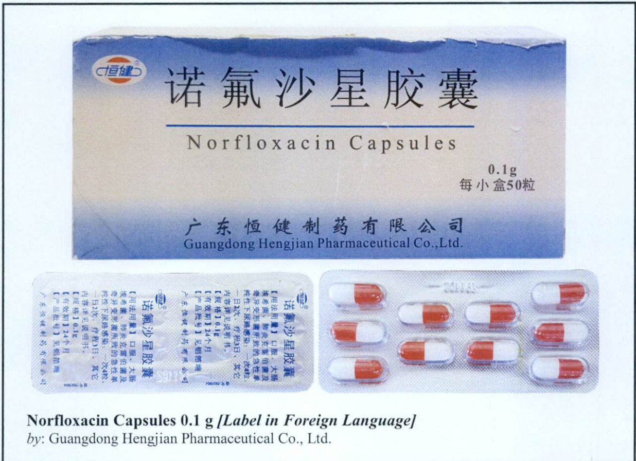
Norfloxacin Capsules 0.1 g [Label in Foreign Language] by: Guangdong Hengjian Pharmaceutical Co., Ltd.